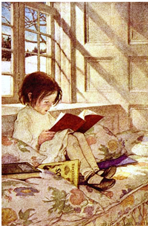
A Child's Garden of Verses av Jessie Willcox Smith

Vad skiljer min första bokupplevelse från den nu så populära Twilight-serien, eller The hunger games (som väl mer påminner om William Goldings Flugornas herre som kom på engelska 1954, i svensk översättning 1960)? Nu får jag erkänna att jag inte läst The hunger games , och inte sett filmen. Nej, jag kom i stället att tänka på en annan populärkulturell klassiker, filmen Gladiator som redan har tolv år på nacken. Den har ett motiv gemensamt med Greven av Montecristo , mer om det senare.