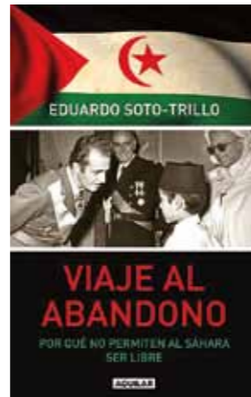
"Resa till försummel-sen" kom ut på spanska 2011.

Promarockansk lobby bildas. 1974 utsåg Franco Arias Navarro till premiärminister och sände förslaget om självbestämmande