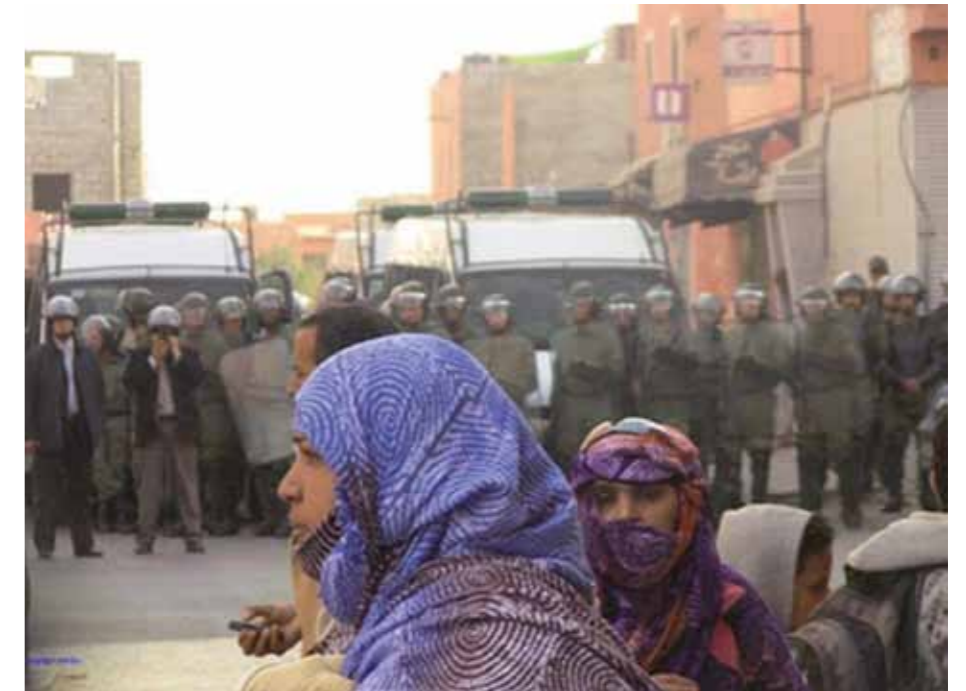
Marockanska poliser och soldater vid en manifestation i Smara i maj.

Jag har stämt möte med honom i bokhandeln Tuareg i småstaden Gran Tarajal