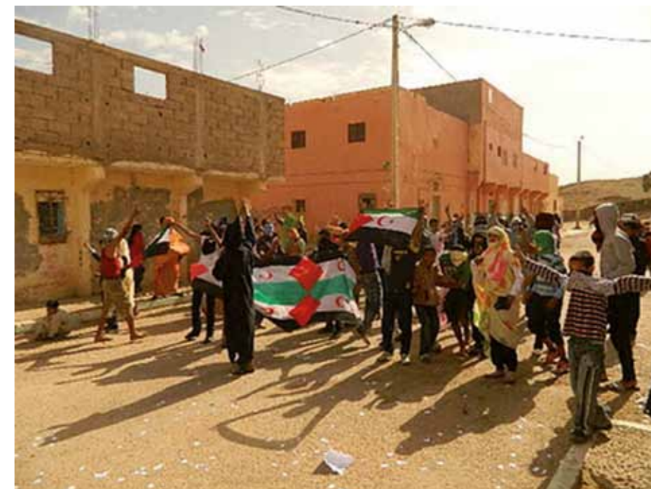
Manifestationer i den ockuperade staden Smara i maj.

– Det var paradoxalt att en del spanska militärer reagerade mot trepartsöverenskommelse. Först bekämpade de Polisario och se-