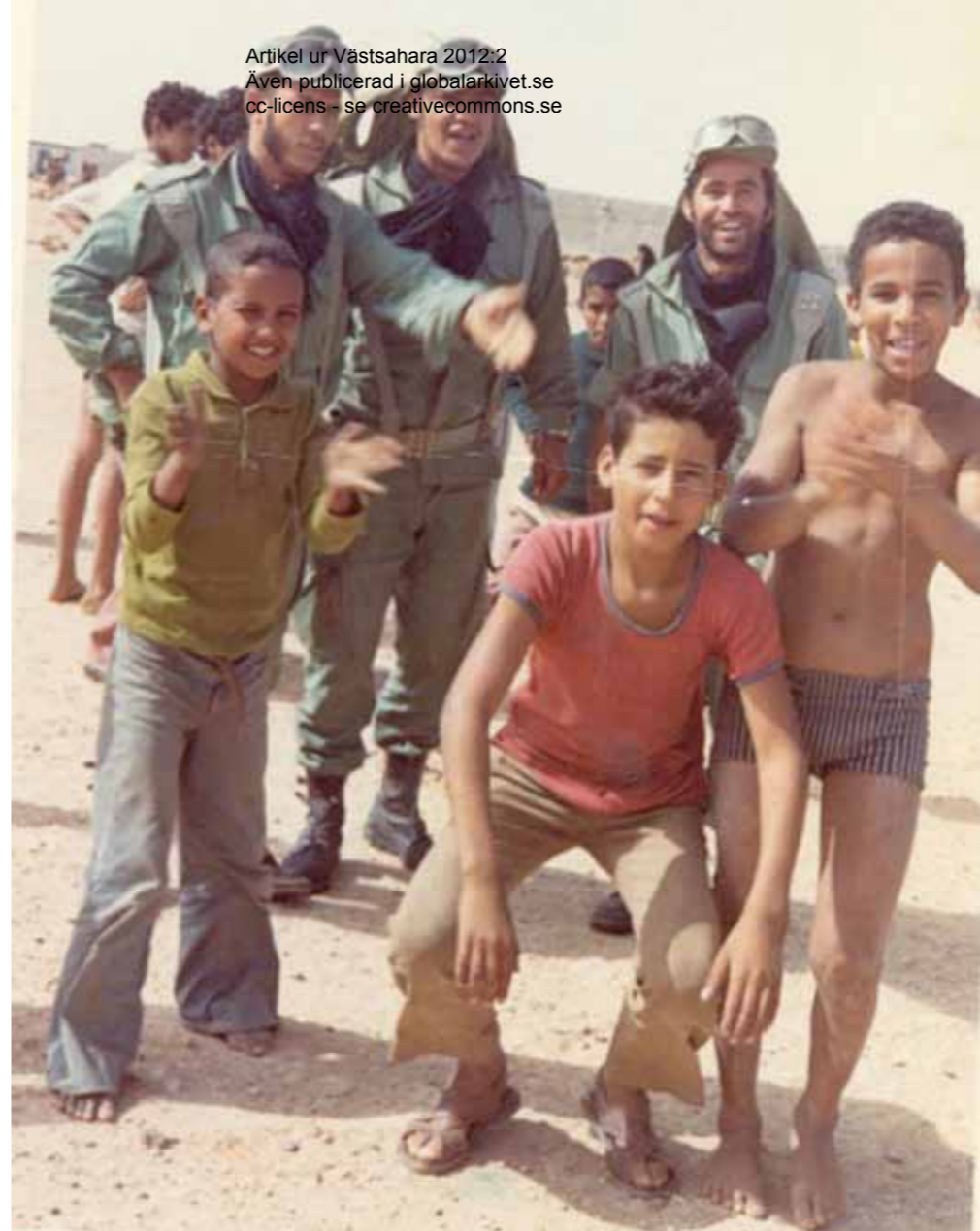
Spanska soldater och västsahariska (?) barn 1974 i Spanska Sahara.

Artikel ur Västsahara 2012:2 Även publicerad i globalarkivet.se cc-licens - se creativecommons.se