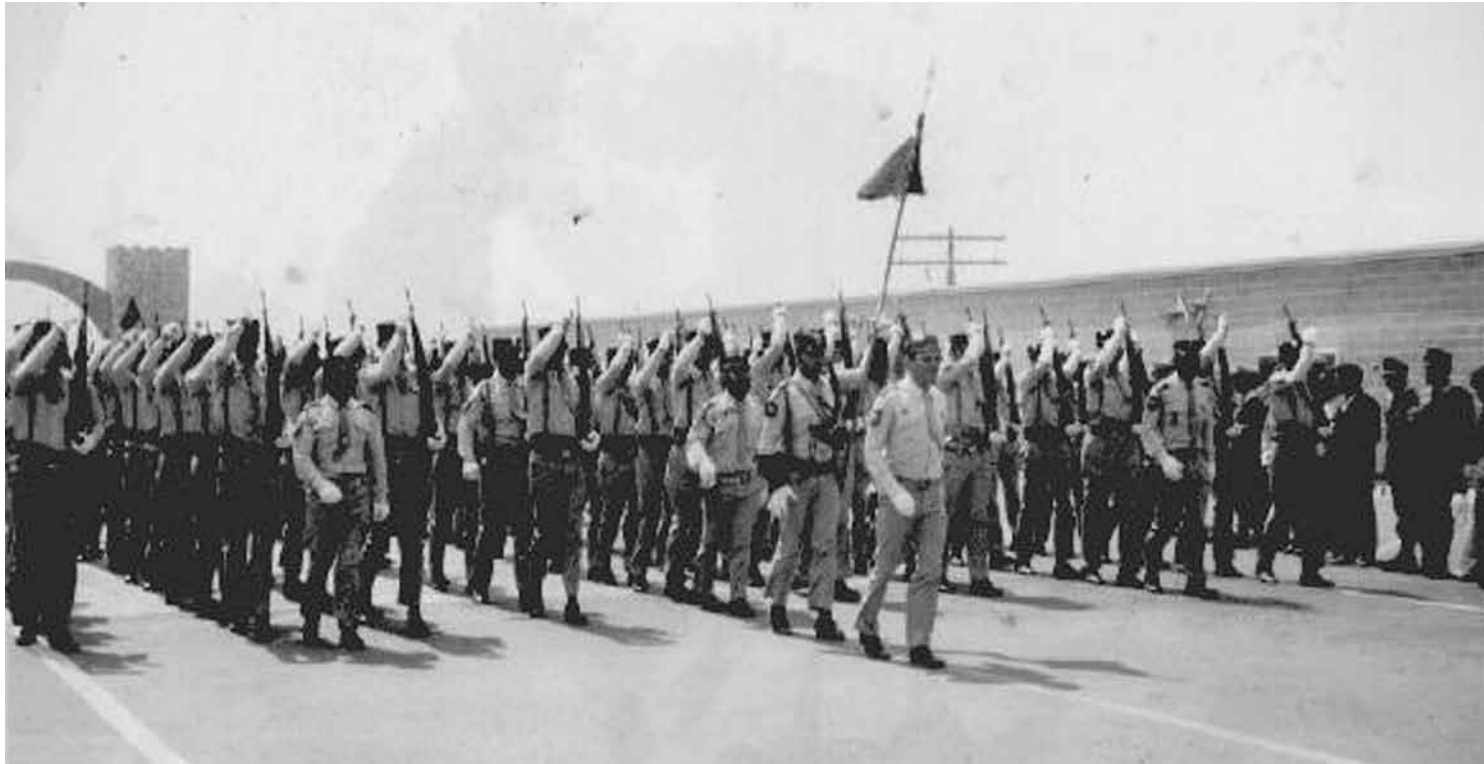
Spanien "fick" Spanska Sahara vid Berlinkonferensen 1884 då Europas kolonialmakter delade upp Afrika mellan sig.