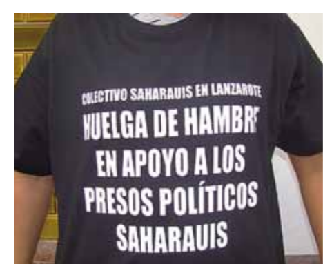
Spanjorer på Kanarieöarna stöder hungerstrejkande västsahariska politiska fångar.

– Dagens spanska regeringar, vare sig de är socialdemokratiska eller borgerliga, stöder åtgärder som gynnar Marocko på grund av ekonomiska intressen som att den spanska fiskeflottan får fiska utanför Västsaha-