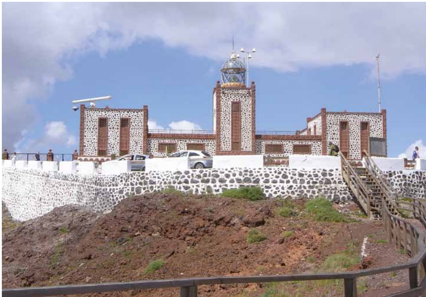
Från fyren La Entallada på Fuerteventura kan man vid klart väder se Västsaharas kust. Med radar kan man kontrollera båtar med fisk – och flyktingar.

Solidaritetsprojekt. Den speciella känslan av samhörighet som kanarierna har för västsaharierna framträder inte bara i en vänlig och positiv attityd gentemot det afrikanska broderfolket utan även i olika solidaritetsprojekt. Organisationer som Amigos del Pueblo Saharai (det västsahariska folkets vänner) och Asociación del Pueblo Saharai de Fuerteventura (Fuerteventuras förening för det västsahariska folket) satsar på olika bi-