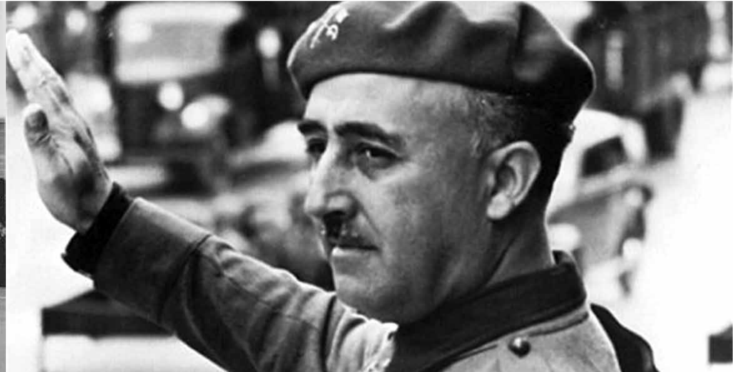
Spaniens diktator general Francisco Franco avled i november 1975.