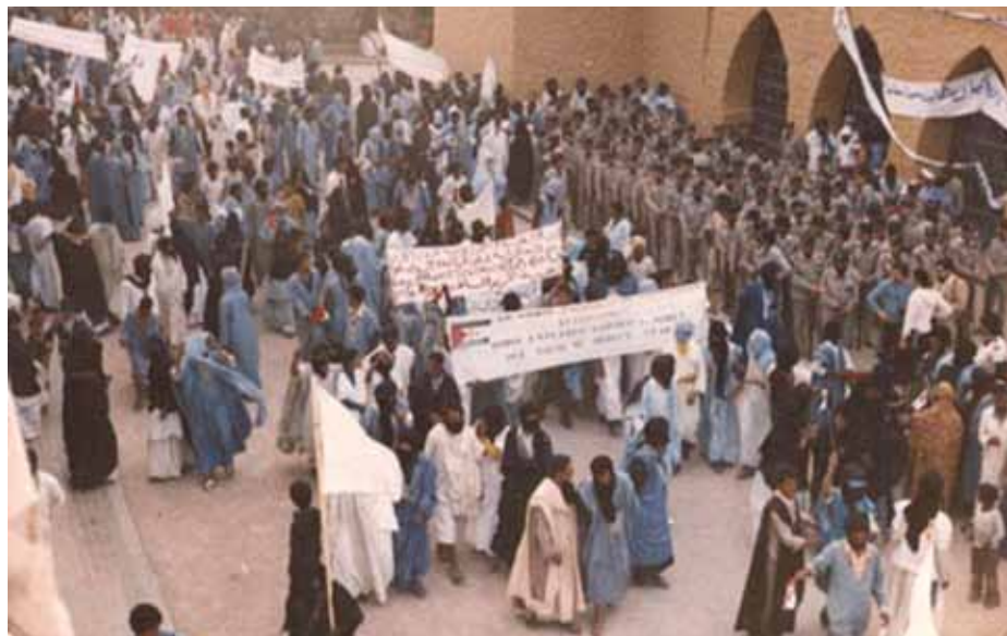
Demonstration till stöd för Polisario Front i El Aaiún 1975.

Trepartsöverenskommelsen. Den 14 november slöts den illegala trepartsöverenskommelsen i Madrid. Representanter från Spanien, Marocko och Mauretanium avgjorde västsahariernas framtid utan deras medverkan. Och om folkomröstning inte ett enda ord. Fördraget gav Marocko rätten att ockupera två tredjedelar av den norra delen och Mauretanium en tredjedel av den södra. Spanien fick behålla 35 procent av aktierna i fosfatgruvan samt fiskerättigheter.