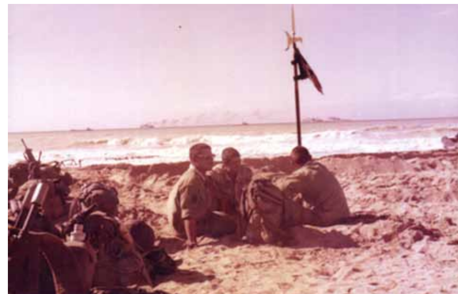
De sista spanska soldaterna väntar på stranden för överfart till Kanarieöarna.

Artikel ur Västsahara 2012:2 Även publicerad i globalarkivet.se cc-licens - se creativecommons.se