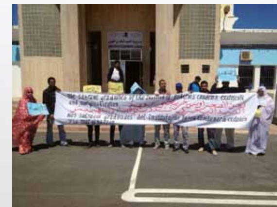
Västsahariska fiskare protesterar mot att jobben går till marockaner. El Aaiún 20 juni.

I El Aaiún 20 juni samlades representanter för tre fiskeorganisationer utanför Tekniska institutet för havsfiske, där de själva utbildats.