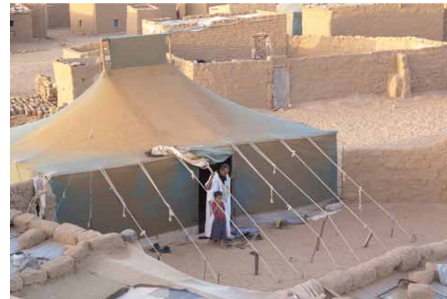
Långt från kungens palats bor de västsahariska flyktingarna i tältlägret Dakhla i Algeriet sedan 37 år.