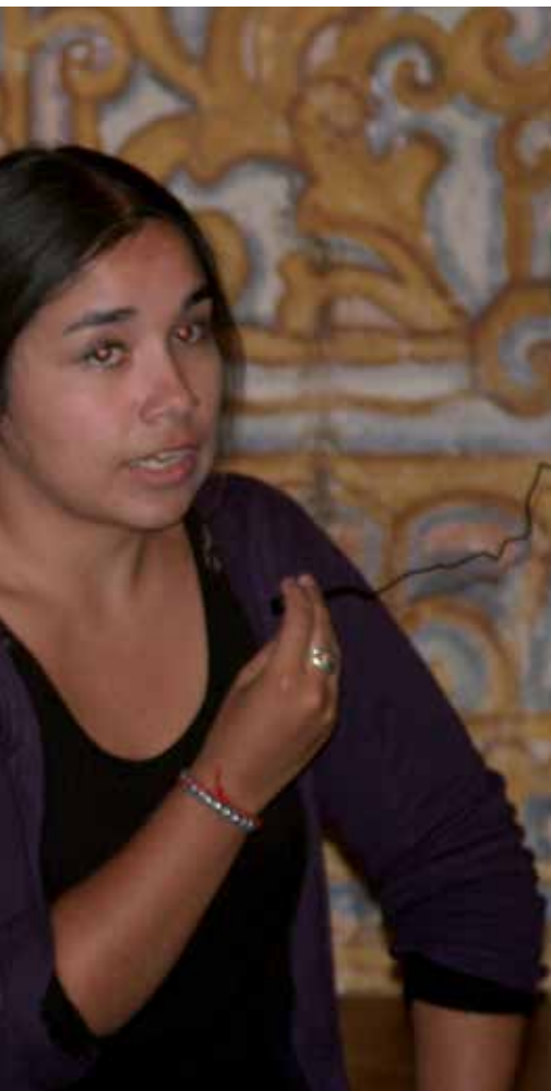
Elket i Chile talar vid hearingen i dammbyggen

dödshot och utsatts för hård press på olika sätt: