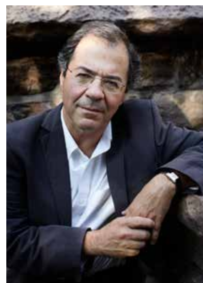
Göran Rosenberg