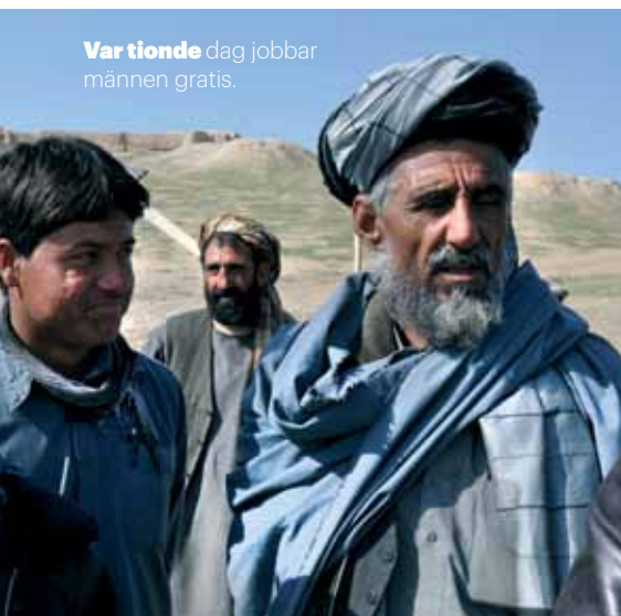
Var tionde dag jobbar männen gratis.