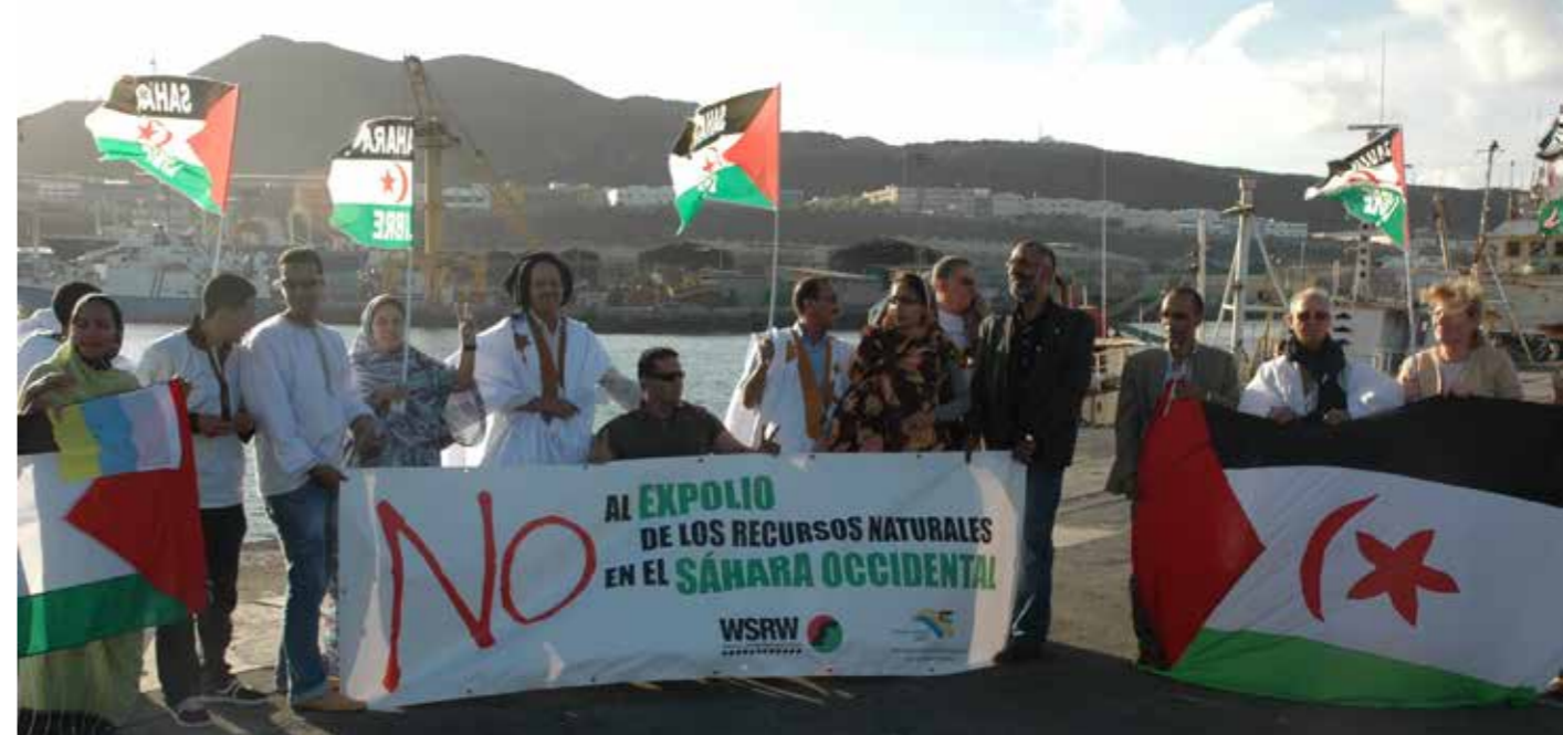
Västsaharier i Las Palmas hamn protesterar mot stölden av naturresurser.