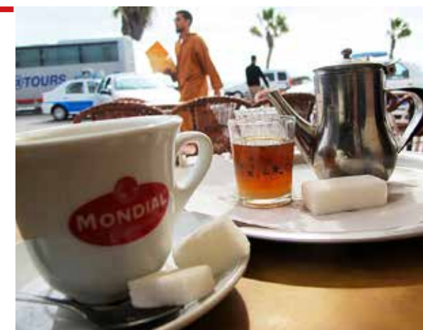
Dakhla har börjat locka turister i liten skala på Medelhavsvis.