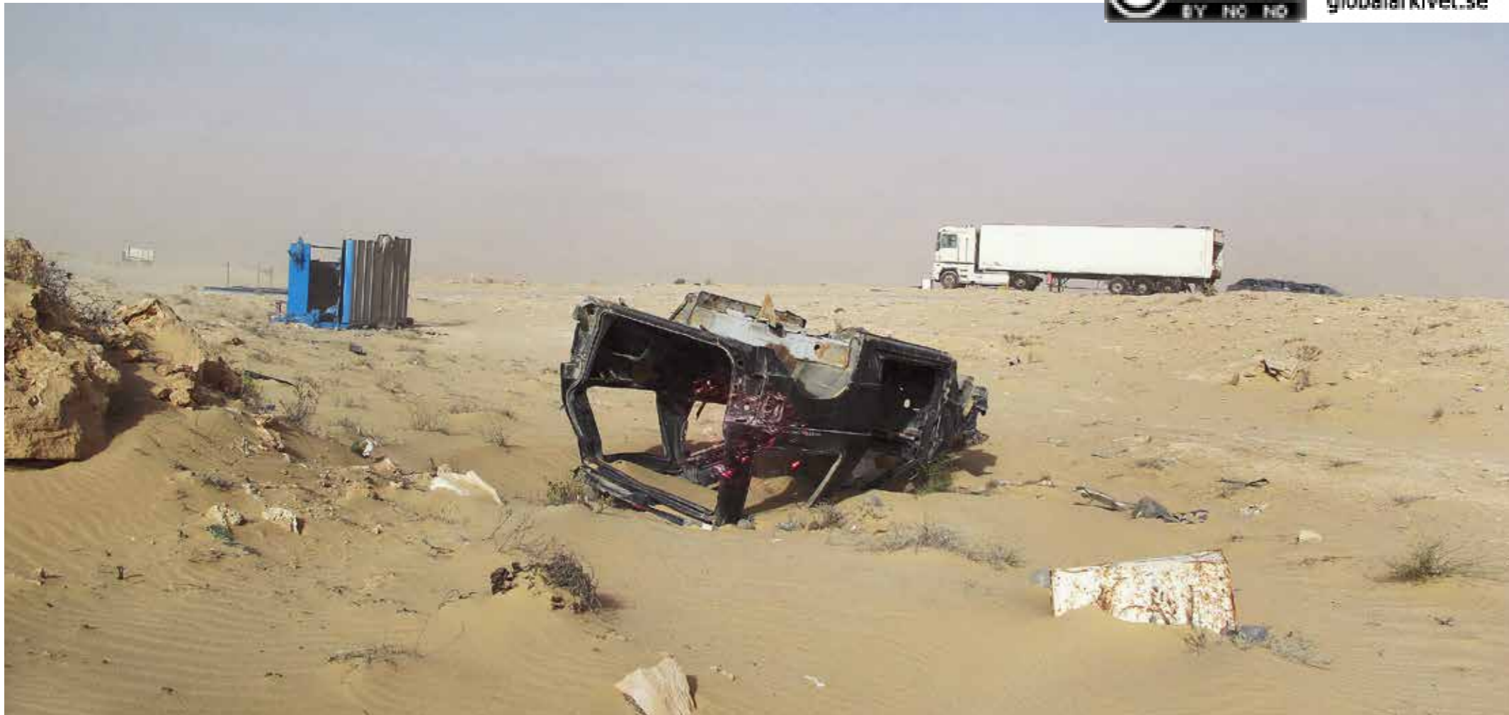
Vägen från Mauretanien till Västsahara och Dakhla går genom ett 4 kilometer ingenmansland. Ett gropigt sandlandskap utan vägbeläggning, fyllt av minor och bilvrak.