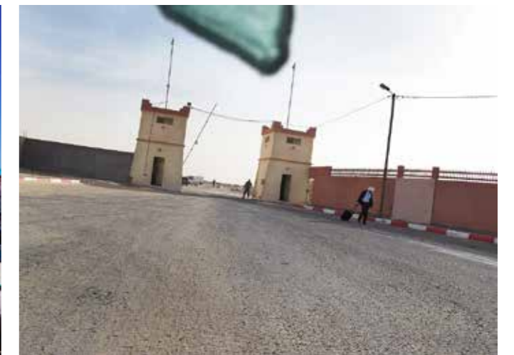
Porten till Västsahara går genom den 220 mil långa minerade sandmur som Marocko byggde på 80-talet.

Saharawis: Poor People in a Rich Country. Han skriver: Här kan man inte leva ett normalt liv med sin familj. Det är som att bo i ett stort fängelse.