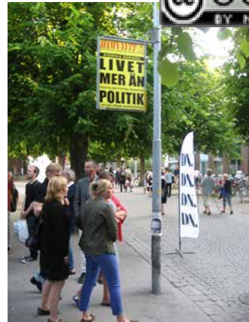
Det vimlar av folk på Visbys gator.