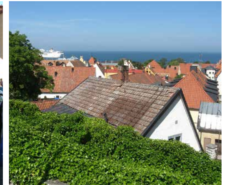
Under Almedalsveckan chockhöjs priserna på boende i Visby.