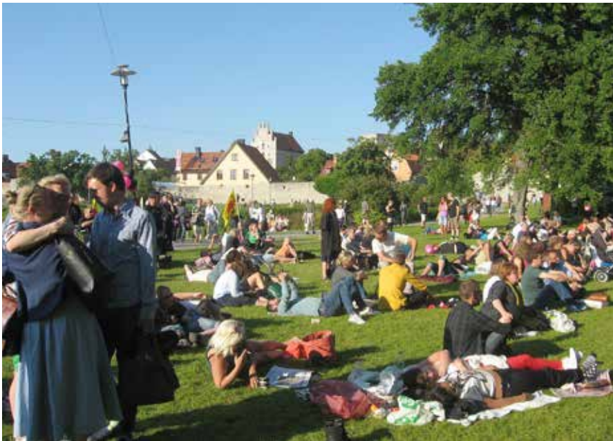
I Almedalsparken väntar åhörare på att partiledarnas tal ska börja klockan 19.