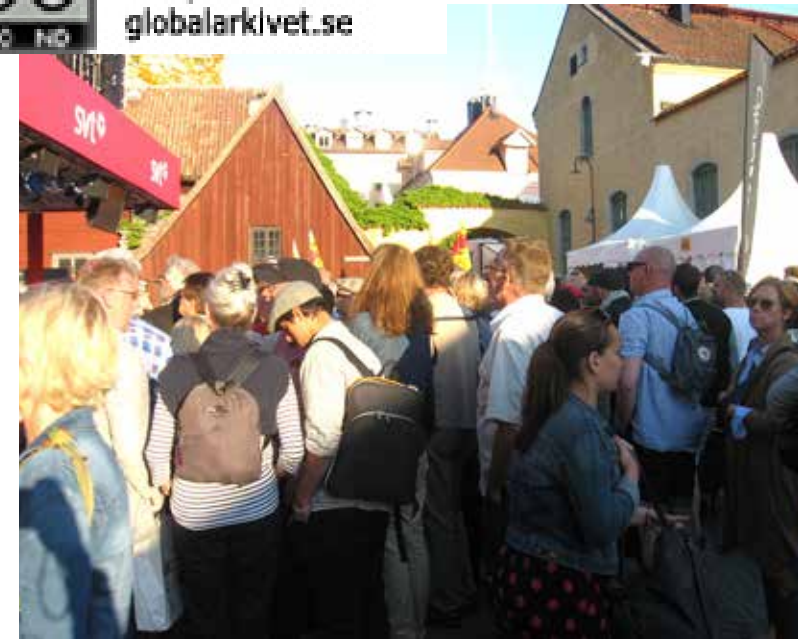
Mest folk trängs framför TV-kanalernas direktutsända partiledarutfrågningar.