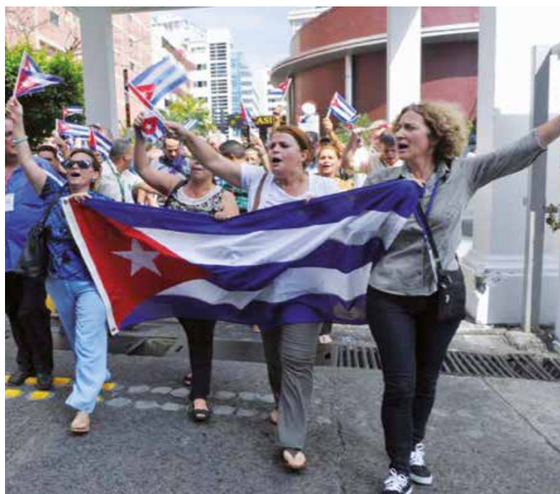
Demonstration för Kuba på väg till Folktoppmötet

USA som hade tvingats gå med på Kubas närvaro på toppmötet, svarade med att skicka dit Miami-terrorister.