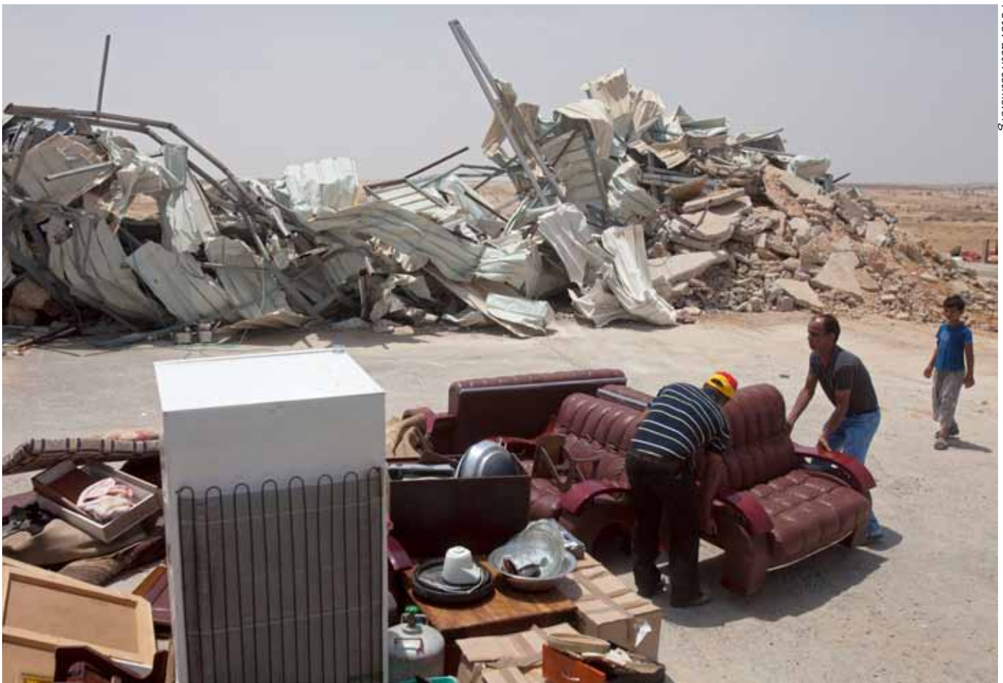
En beduinfamilj i Negevöknen har fått sitt hem demolerat av den israeliska armén

av olika etnicitet och religion. Detta är emellertid något som håller på att förändras. De senaste åren har det israeliska parlamentet stiftat flera lagar som är tydligt riktade mot den palestinska minoriteten. Ett exempel på apartheid i Israel skulle till exempel kunna vara en lag som förbjuder palestinier från Gaza eller Västbanken att få israeliskt medborgarskap eller uppehållstillstånd genom giftermål med en palestinier från Israel.