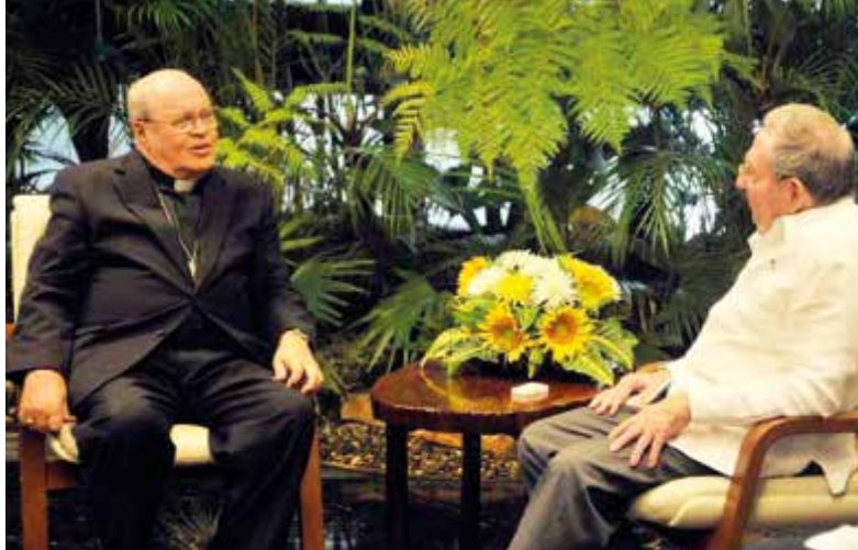
President Raul Castro och kardinal Jaime Ortega

I slutet av oktober hade påven bjudit in förhandlarna till Rom. Och det var där de två parterna vaskade fram överenskommelsen om fångutbyte och diplomatiska