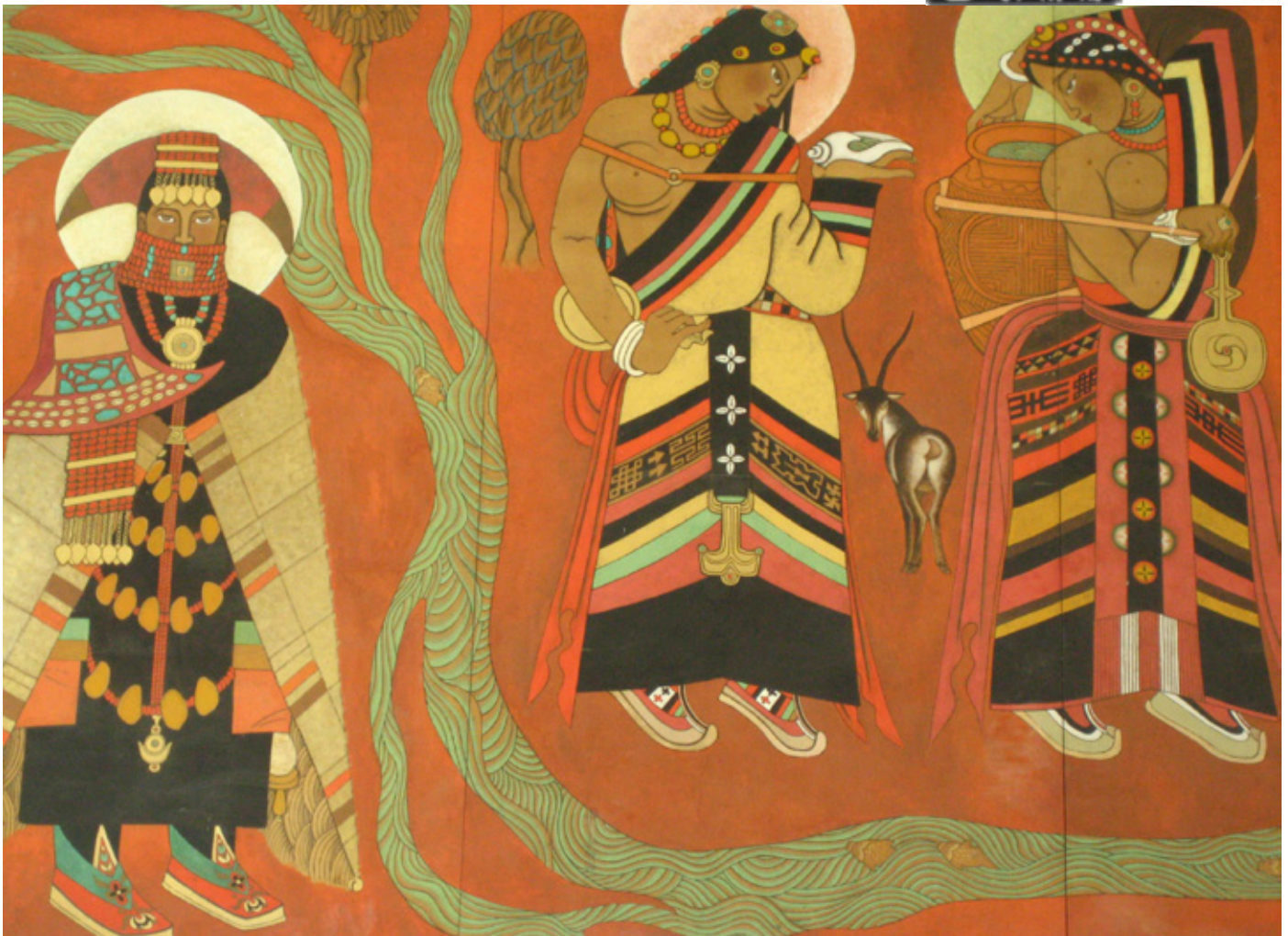
Denna tavla möter turisterna vid ankomsten på Lhasas flygplats, tibetanska kvinnor avbildade minst sagt stereotypt, sexistiskt och helt bisarrt. Varför skulle de springa runt med bröstet bara?

► samt stark ställning i att förvalta familjens egendom är kanske snarare en kulturell faktor som hade mer att göra med nomadlivet och socio-ekonomiska fördelar än en effekt av den nya religionen som infördes mellan 800–1200-talet.