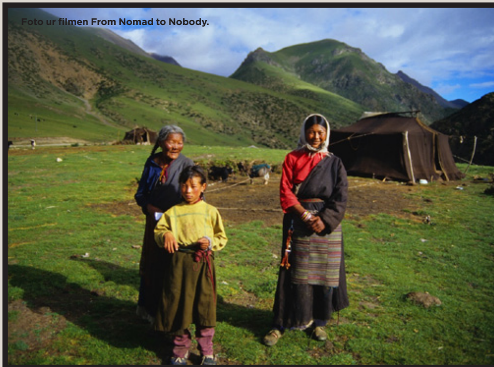
Foto ur filmen From Nomad to Nobody.

Filmen "From Nomad to Nobody" målar upp ett viktigt skeende som händer just nu, en kulturell utrensning där tiden visar på att det är bråttom om inte de tibetanska nomaderna helt ska utplånas. För precis som titeln menar så uttrycker nomader i filmen att när de väl blivit bosatta i de nya husen är de inte längre nomader utan "nobodys". Filmen rekommenderas till dig som vill få inblick i den traditionella nomadkulturen på Tibets slätter och samtidigt få kunskap om den respektlösa hanteringen av tibetanernas tusenåriga traditioner som Kinas styre utsätter den för. *