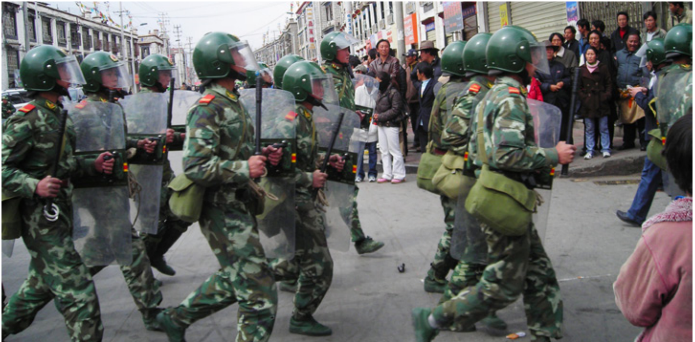
Kinesisk militär stormar Lhasa under upproret 2008.

och relaterade rättsliga ramverk. Viktigt att notera är att ekonomisk politik förblev centralmaktens ansvar och att tibetanerna på pappret skulle garanteras religiösa, kulturella och utbildningsrelaterade rättigheter, samt vissa högre poster i stadsapparaten. "Nationens intresse" skulle dock alltid sättas högst och tolkningsföreträde gavs till centralmakten. Dessa lagar och regler har uppdaterats under åren men grunden har förblivit densamma. Det största problemet med dessa mer eller mindre rättsliga strukturer är dock att de existerar parallellt med ett utomrättsligt system i vilket all verklig makt ligger.