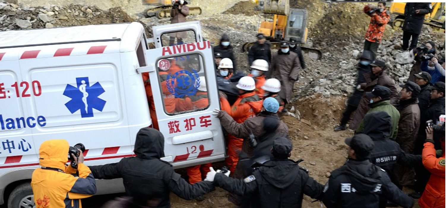
Räddningsarbetare söker efter överlevande efter jordskredet som krävde över 80 gruvarbetares liv.

De 20-30 inlägg om miljöförstörrelse i Lhasa och andra tibetanska regioner orsakad av gruvsdrift som jag lagt upp på Weibo har alla "krypterats", vilket är detsamma som att de dolts eller tagits bort. Men innan detta inträffade kopierade jag alla inlägg (inklusive några svar). Här är några av dem: