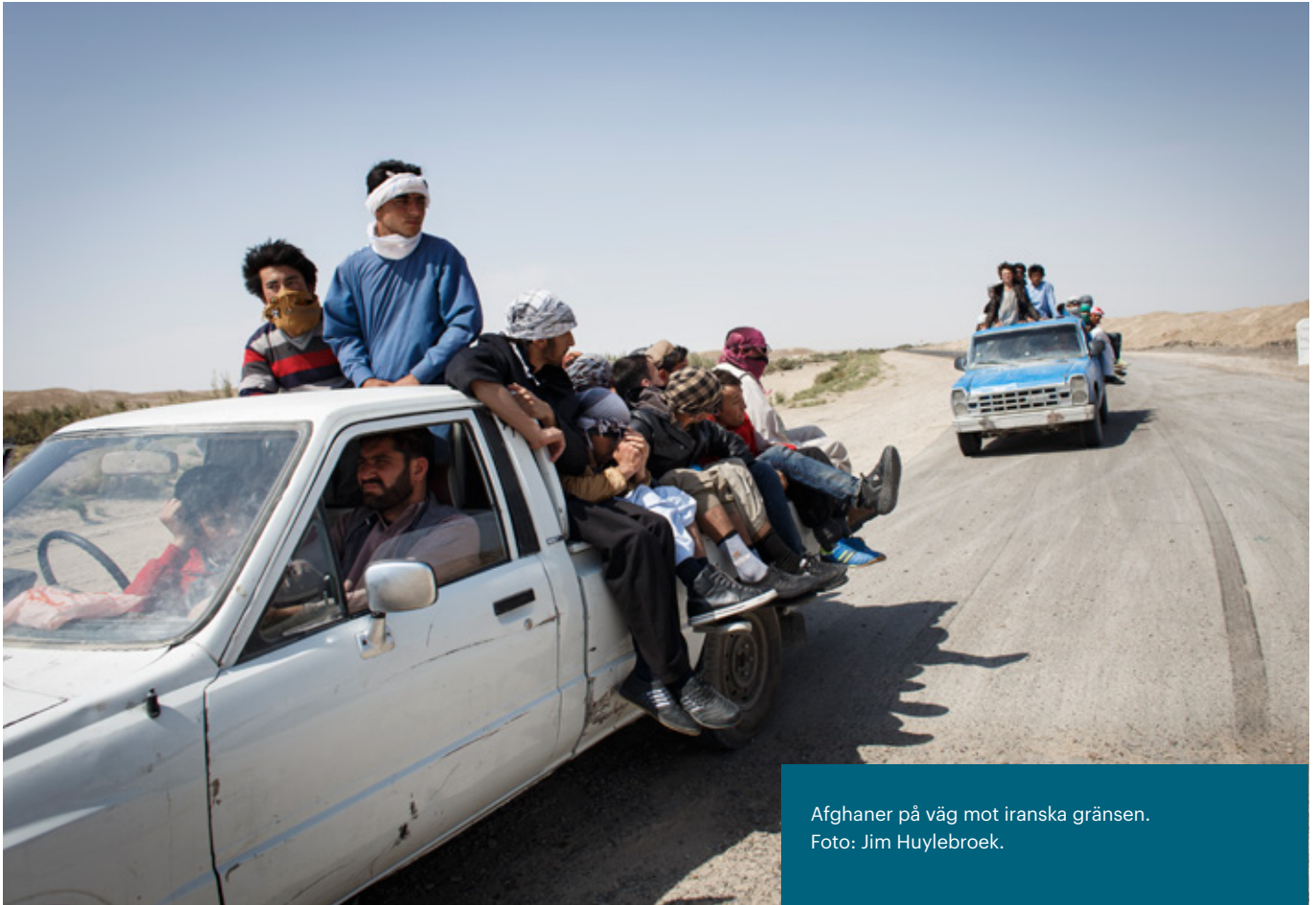
Afgbaner på väg mot iranska gränsen.

stanna. Enligt Pro-Asyl, den största enskilda organisationen i Tyskland som arbetar med frågan, kommer kanske 7 000 afgbaner att beröras av detta hot om utvisning.