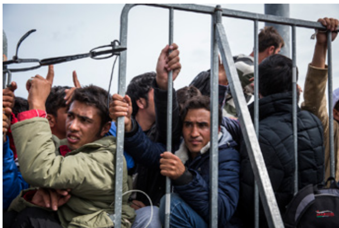
Afghanska flyktingar vid ett polisstaket i Slovenien trängs i väntan på att få komma på bussar för vidare transport till Österrike.

Situationen i Sverige är annorlunda. Enligt svenska myndigheter ansöker nästan alla flyktingar också om asyl, endast ett fåtal har fortsatt till Norge. Den 1 november hade 21 551 asylsökningar lämnats in i Sverige av afgha-