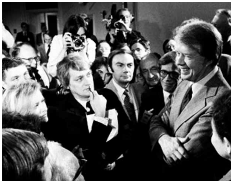
Jimmy Carter 1977