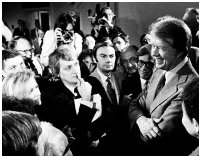
Jimmy Carter 1977