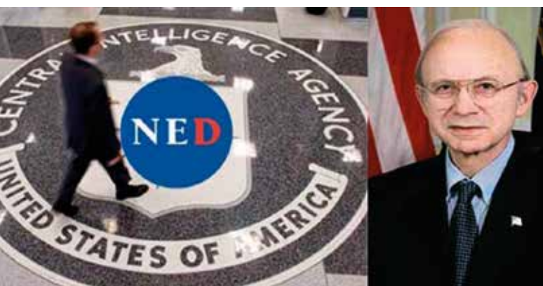
Allen Weinstein grundade NED för ”civilt” CIA-arbete

En stor del av USAs pengar kanaliseras via NED, National Endowment for Democracy. Det grundades av Allen Weinstein 1982, på president Ronald Reagans uppdrag. 1991 beskrev han öppenlydligt NED:s syfte: ”Mycket av det vi gör nu, via NED, gjorde CIA i hemlighet för 25 år sedan”.