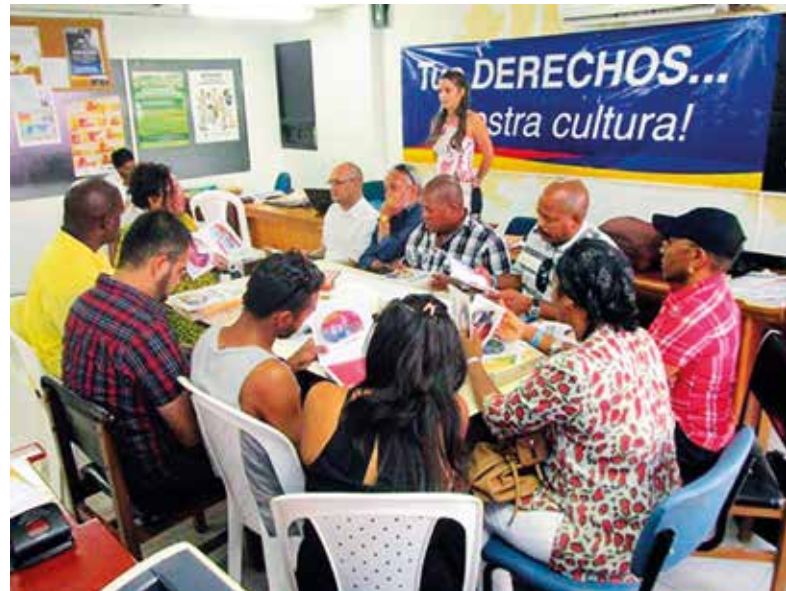
IRED, Cimarron och Corporación Caribe på Skuggrapportutbildning på Hotel Tuquendama i Bogota, 4.10. 2016