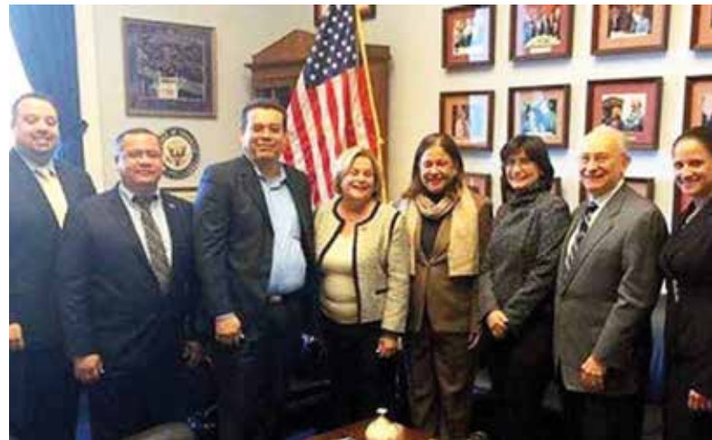
MRS tillsammans med Ileana Ross-Lehtinen i Washington