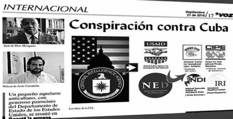
Faksimil av tidningsuppslaget med Acevedos artikel