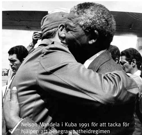
Nelson Mandela i Kuba 1991 för att tacka för hjälpen att besegra apatheidregimen