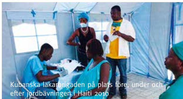
Kubanska läkarbrigaden på plats före, under och efter jordbävningen i Haiti 2010