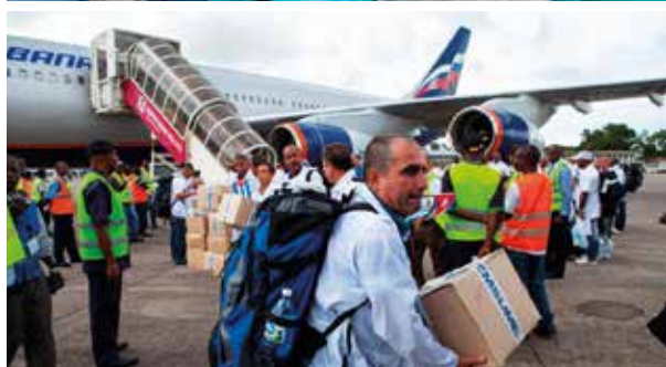
Kubanska läkarbrigaden Henry Reeve på väg till Nigeria för att bekämpa Ebolaepidemin