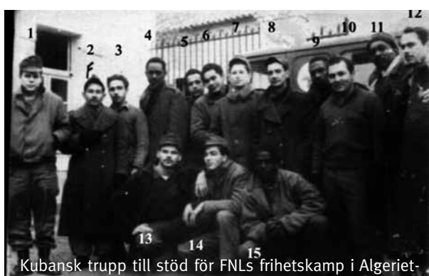
Kubansk trupp till stöd för FNLS frihetskamp i Algeriet-

Detta från en karibisk ö, med elva miljoner invånare och med en BNP som är hälften av Kazakstans. Vilket land i tredje världen har någonsin utövat ett inflytande långt utanför sin närmiljö? Någon ödmjukhet kunde vara passande för alla de små människor, som aldrig lyft ett finger i sitt liv för att förändra världen men som nu sitter och kritiserar en gigant. Som under femtio år ofta var tredje världens enda hopp.