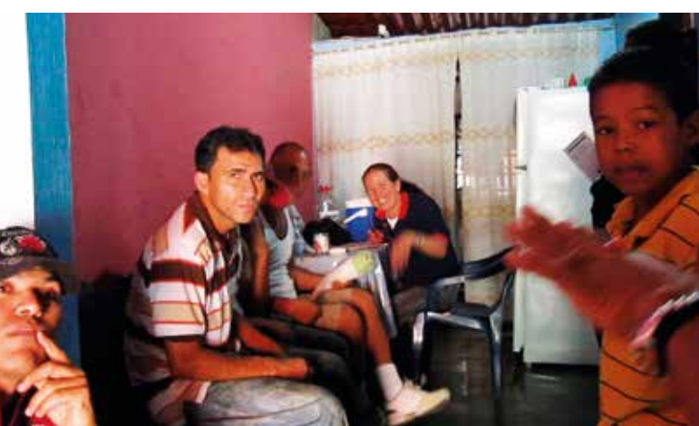
Första läkarbrigaderna till Venezuela 1999

Kissinger var förbluffad – han hade visserligen väntat sig sovjetisk inblandning, men inte detta. CIA hade talat om några få tekniska rådgivare, men plötsligt strömmade det in tusentals beväpnade kubaner, just när Sydafrika var på väg att krossa gerillan MPLA.