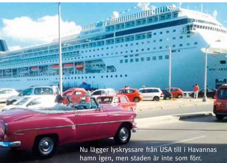
Nu lägger lyskryssare från USA till i Havannas hamn igen, men staden är inte som förr.