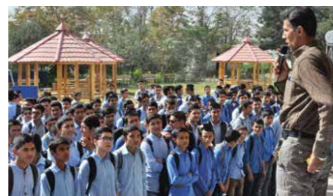
Skoldagen på Bakhtarskolan är uppdelad i olika perioder. Varje period inleds med uppställning på skolgården.