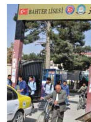
Bakhtarskolan är en av de största i norra Afghanistan.