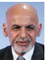
President Ashraf Ghani.

Enligt Ashraf Ghani är hans regering fast besluten att uppnå fred utan att behöva ändra på landets grundlag eller att försvaga de mänskliga rättigheterna, något som andra parter i konflikten vill.