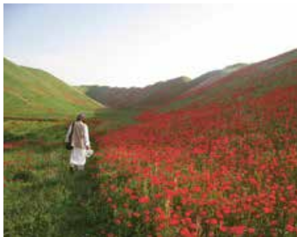
Opiumodlingar i Badghisprovinsen.

HISTORIEN OM HUR Ghormach och Murghab kom att bli storproducenter av opium är en spegelbild av utvecklingen i det moderna Afghanistan. Provinsen Badghis