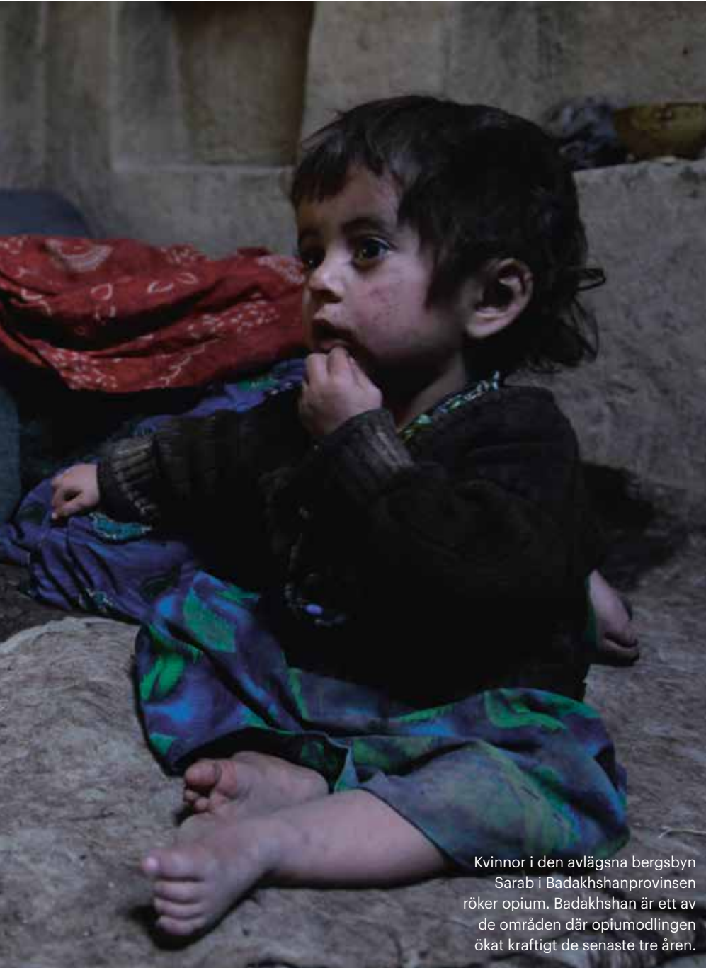
Kvinnor i den avlägsna bergsbyn Sarab i Badakhshanprovinsen röker opium. Badakhshan är ett av de områden där opiumodlingen ökat kraftigt de senaste tre åren.