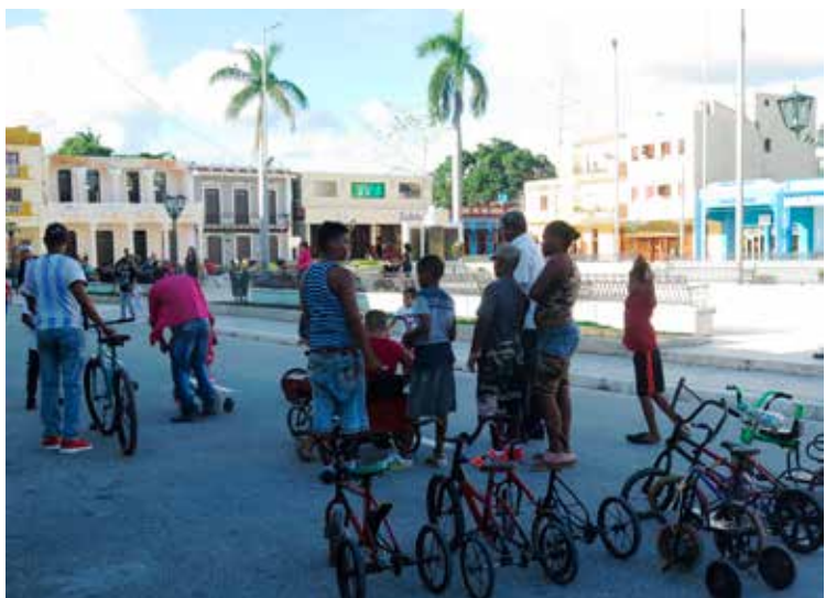
Lördagseftermiddag på Revolutionstorget i Bayamo. Biltrafiken är stoppad och barnen kan lära sig cykla.