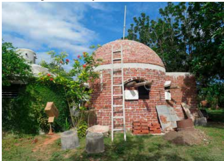
La Finca del Medio, en permakulturgård i Taguasco.