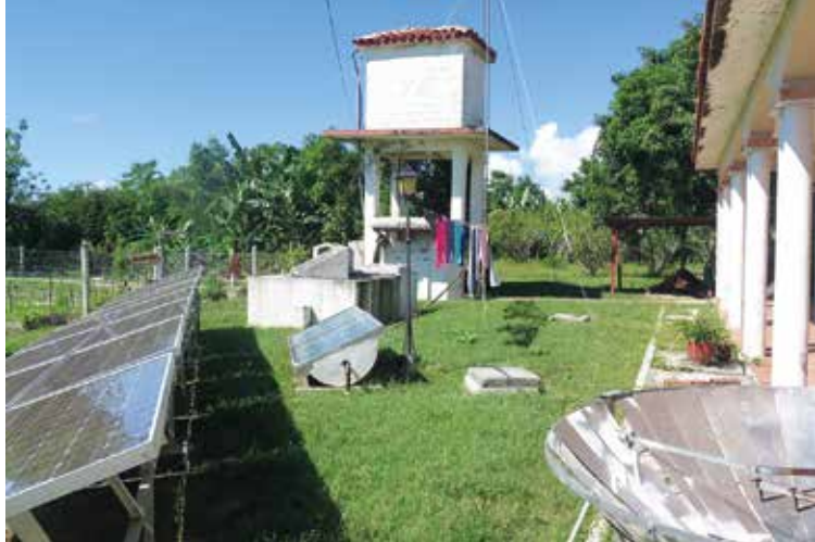
Cubasolars demonstrationsanläggning vid Camiloskolan

Cubasolar – Institutet för förnyelsebara energikällor och låg energiförbrukning – har byggt en liten demonstrationsanläggning i skolan. Föreståndaren