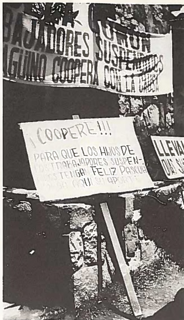
El Teniente-gruvans avskedade har gemensamt soppkök för familjerna.

Mannen blir alltmer osäker på sin roll, svartsjukan gör