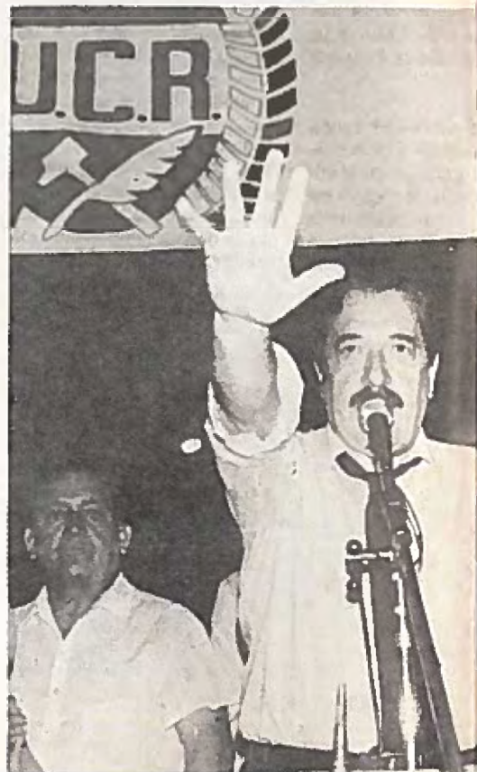
Alfonsin: "Vi får det land vi förtjänar"

Om den nya administrationen får allvarliga problem med att kontrollera militären är frågan om den peronistiska fackbyråkratin inte mindre allvarlig. Denna skulle inte dra sig för att utnyttja folkets rättmätiga krav för sina egna syften. Även om radikalismen inte tänker genomföra en klassförsoning i peronistisk stil går ändå lösningen av den argentinska statens