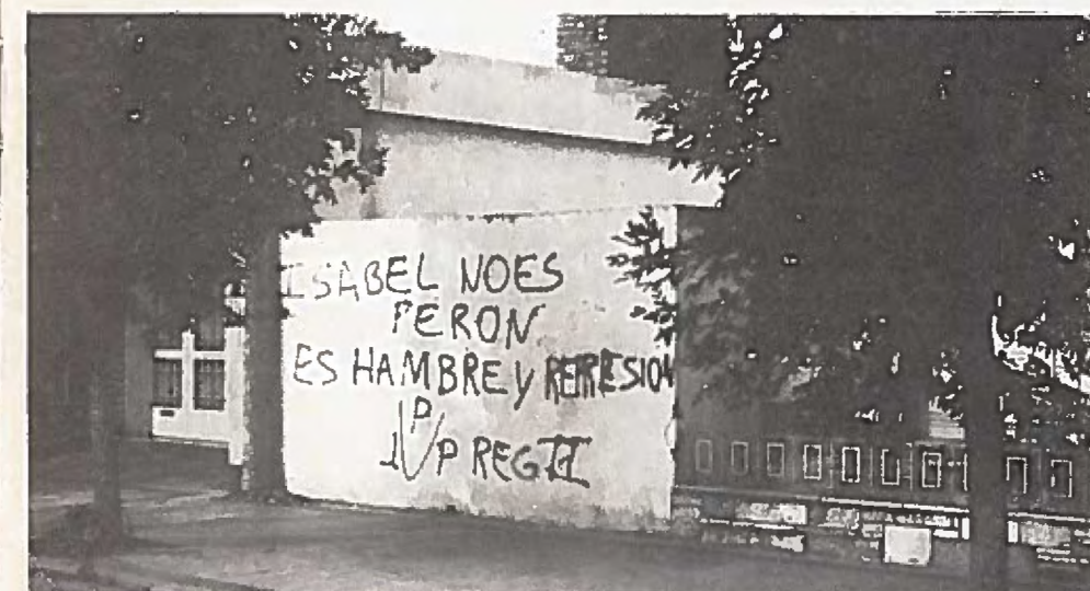
"Isabel är inte Perón, hon är svält och förtryck".

Regeringen har även upprättat en prisinformation, vars första uppgifter blir en frysnings av priserna. Man har också fastslagit marginaler för grossisternas och detaljhandlarnas räntabilitet. Det fattas några detaljer för att även fastslå en generell lönehöjning med runt 48 dollar. Man har åtminstone på kort sikt, avvisat en devalvering av peson.