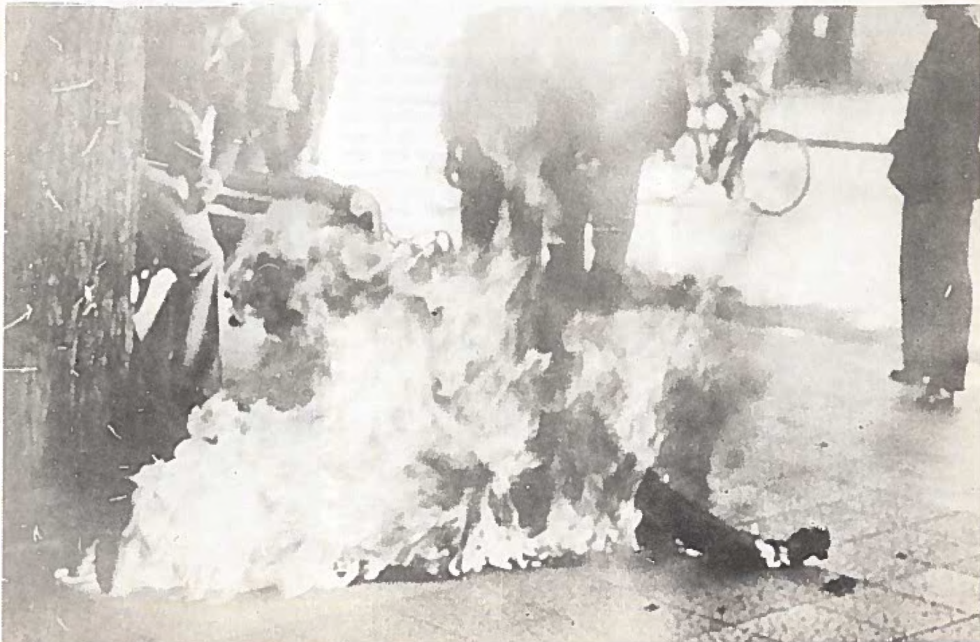
Det yttersta offret... - bild ur "Hoy", 16 november -83