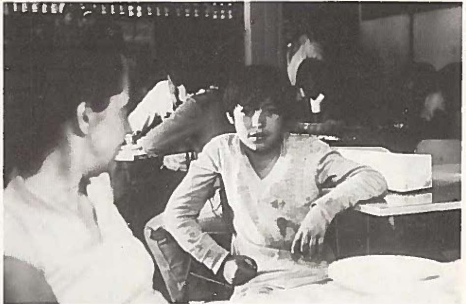
Lurad av världen ...