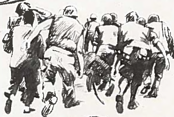
Ill: Mats Andersson

en femtedel av hela garnisonen, på plats. Resten hade åkt hem eller var på fest. Efter El Paraiso (Paradiset) dröjde det tio dagar in i januari innan armén samlade sig till motangrepp. Armén anklagas öppet för att föra ett "9 till 5-krig" med lediga helger (åtminstone för officerarna). Nationella Företagarförbundet frågar i annonser i pressen om armén verkligen håller på att vinna kriget, trots att den ideligen talar om "förintade slag mot de subversiva".