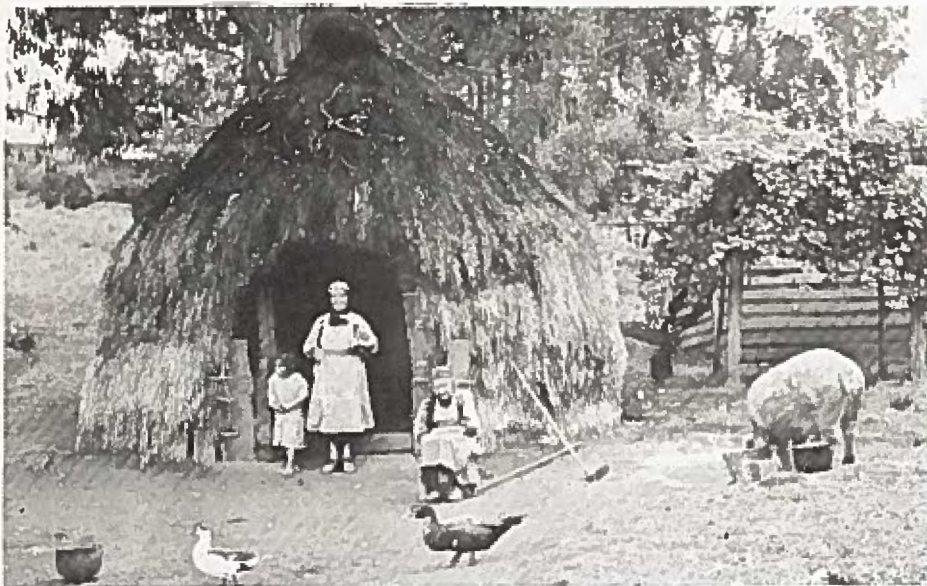
"Ruka", mapuche-hyddan byggs ännu av halm, det billigaste byggnadsmaterialet. I dess mitt brinner alltid en eld.