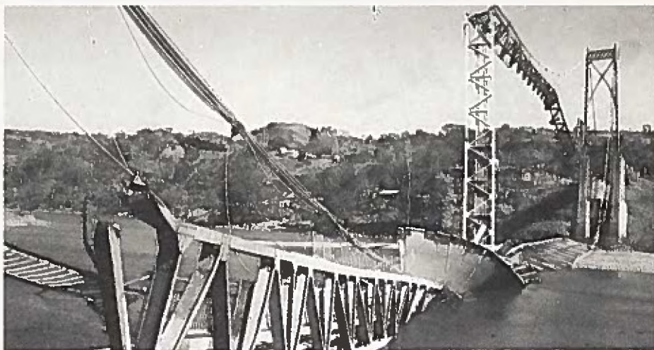
Cuscutlán-bron. Här skulle kaffeskörden ha transporterats ...