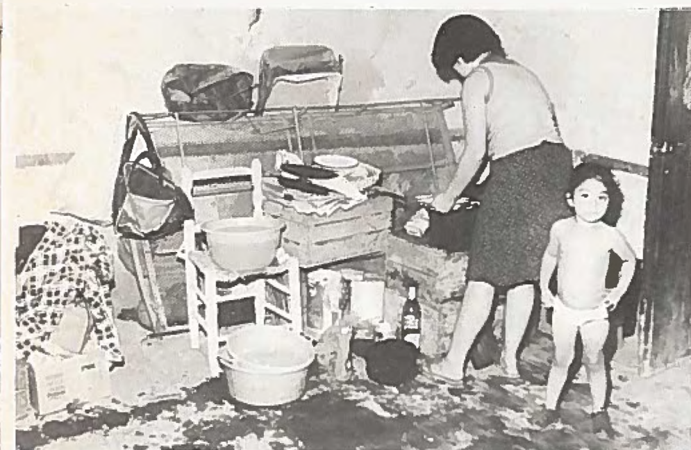
Ska dom få det bättre?