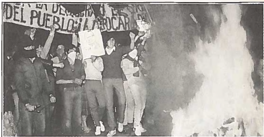
"Pobladores" vid brinnande barrikader: "Allende är med oss!"