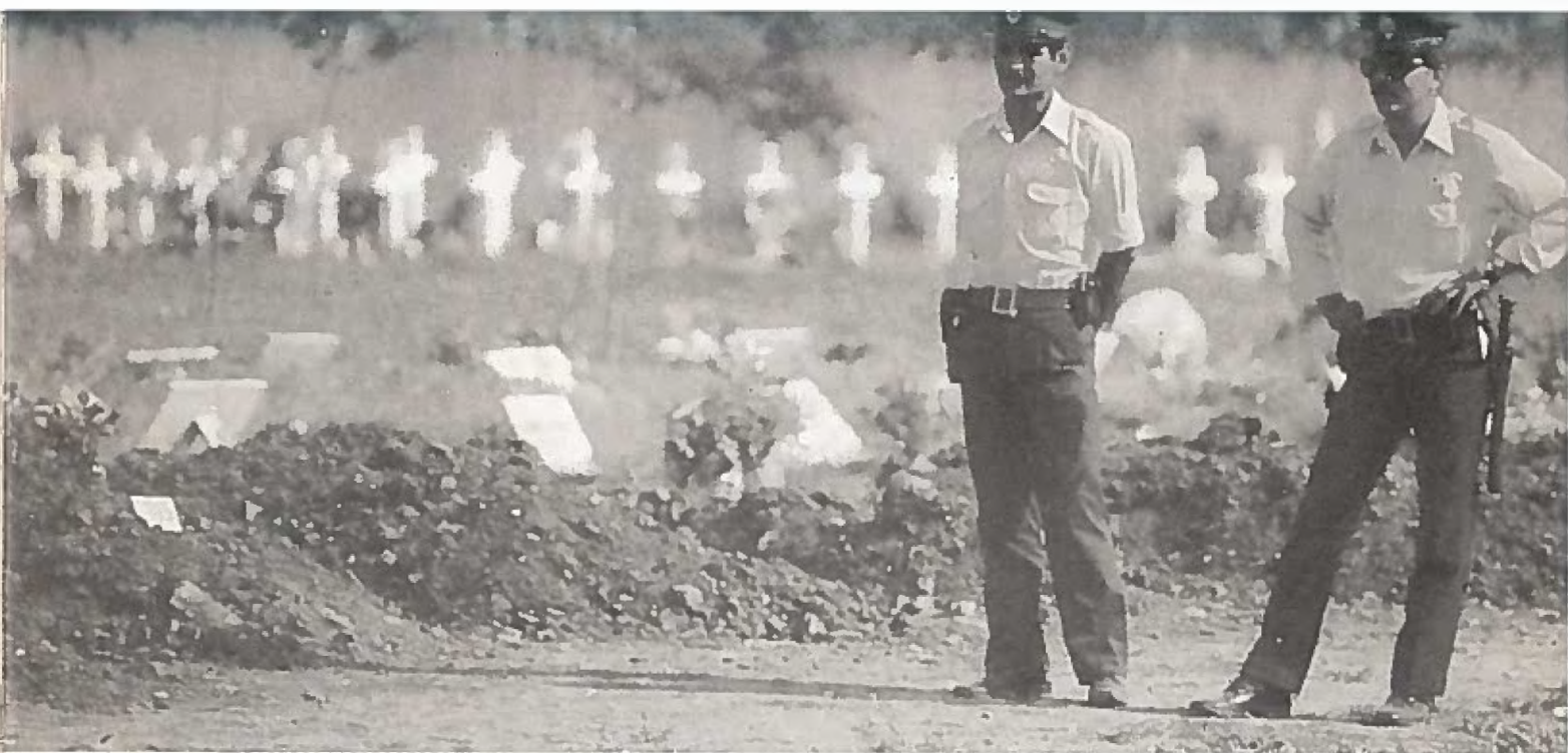
Bödlarna och deras offer.