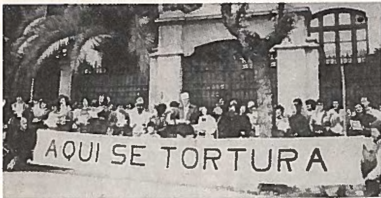
CNI-lokal, Borgoñogatan, Santiago. Vattenkanoner skingrade demonstrationen.

en bilbomb i Buenos Aires, Argentina, där han bodde (1975); samma förfaringssätt användes mot utrikesministern Orlando Letelier, som dödades tillsammans med sin nordamerikanska sekreterare då han startade sin bil i ambassadområdet i Washington. Bernardo Leighton, fd kristdemokratisk senator, sköts ner tillsammans med sin fru i Rom. De överlevde trots svåra skador.