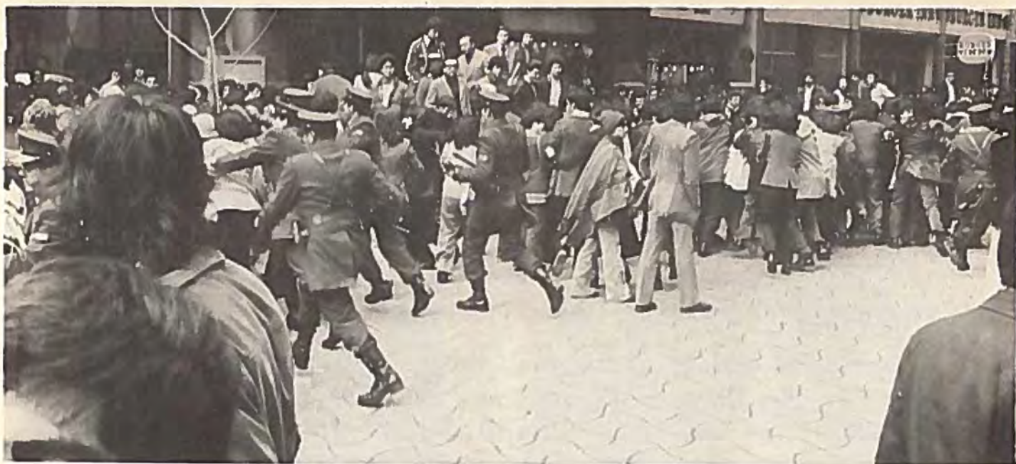
På Ahumada-gatan i Santiago kunde demonstrationen 1 maj bara hållas punktvis. Polisen var snabbt på plats.