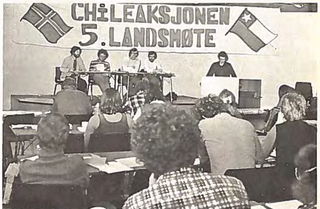
Chileaksjonen i Norge, deras femte landsmöte visade på vilja till fortsatt solidaritetsarbete trots massmedias ovilja att behandla kampen i Chile.