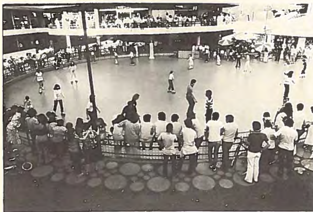
Den undre bilden visar en rullskridskobana intill ett luxuöst köpcentrum i huvudstaden Santiago. Där kan överklassens ungdomar också välja mellan hamburgerbar och flipperhall i värsta nordamerikanska stil.