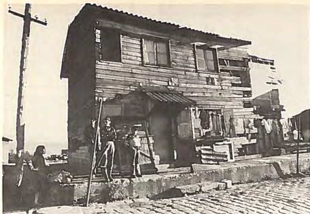
Övre bilden visar ett bostadshus i Lotha, ett kolgruvesamhälle i södra Chile. I det här huset bor flera familjer, och sår, eller värre, bor stora delar av Chiles befolkning.