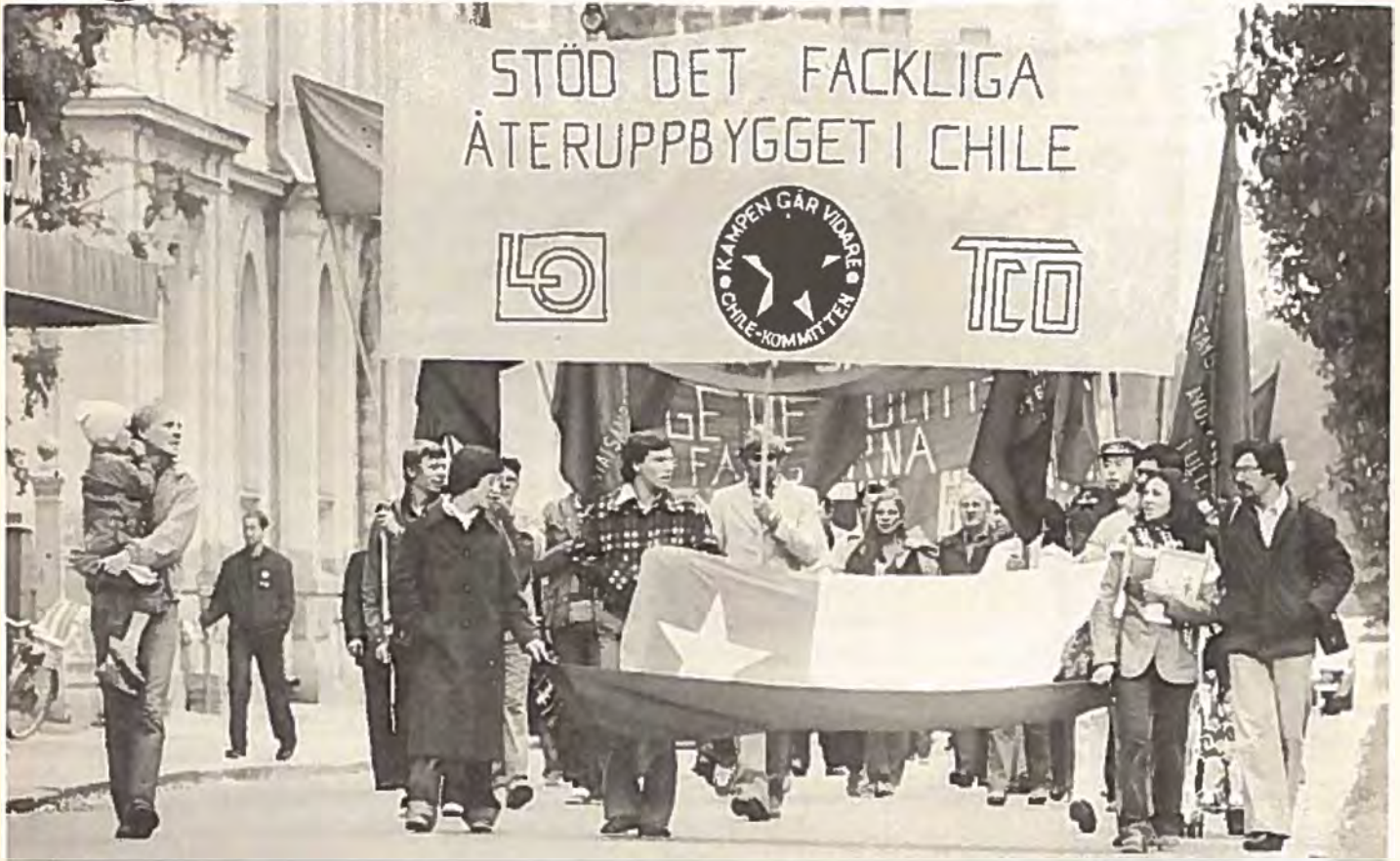
Demonstration i Luleå.