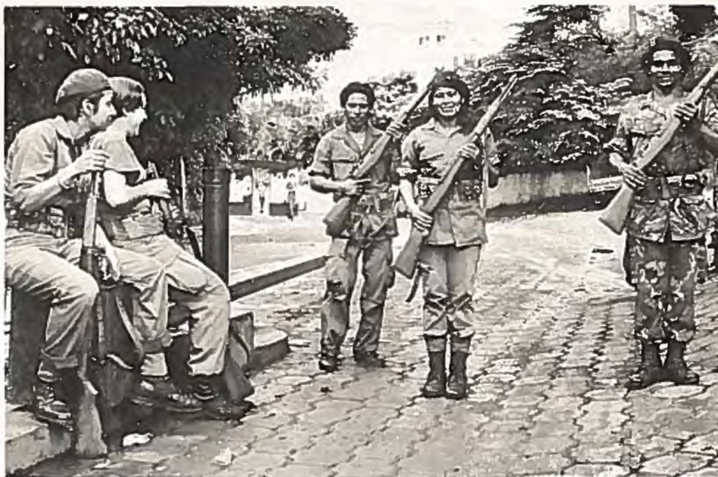
Stora bilden: Sandinistsoldater utanför Somozas fd bunker.

Till höger en väggmålning: "Om nordamerikanerna försöker invadera så slår vår armé tillbaka dem."