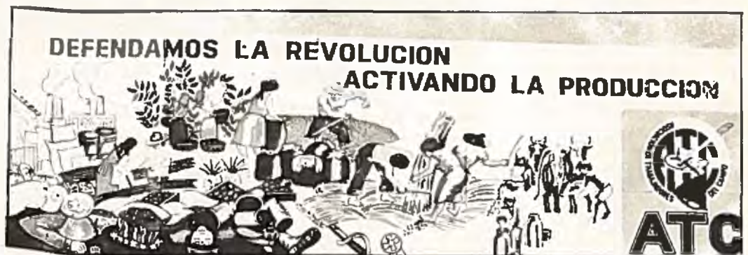
"Låt oss försvara revolutionen genom att höja produktionen", står det på plakatet.