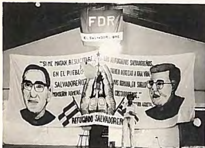
Solidaritetsmöte om El Salvador i Costa Rica (t.v.) Salvadorflyktingar i Honduras (t.h.)