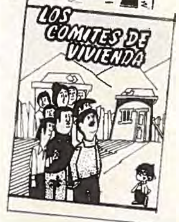
Enkla underjordiska tidsskrifter ger tips om organisering för bättre bostadsförhållanden.