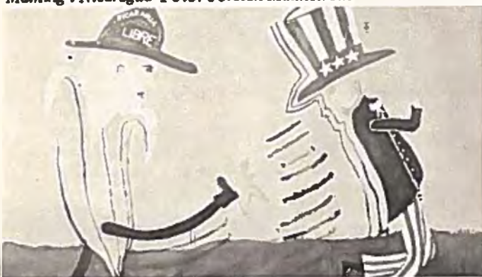
Målning i Nicaragua

o Sovjet stöder visserligen sedan några år mera aktivt den väpnade och civila oppo-