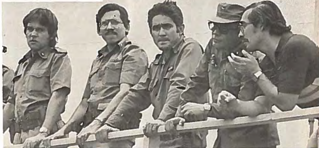
Sandinistregeringen vid ett massmöte fr u Jaime Wheelock, Orlega, Edén Pastora, Tomds Borge och Moisés Hassan.

Genom att avbryta allt USA-bistånd försöker Reagan på samma gång försvaga Nicaraguas regering och stärka den anti-sandinistiska oppositionen. Denna har tidigare