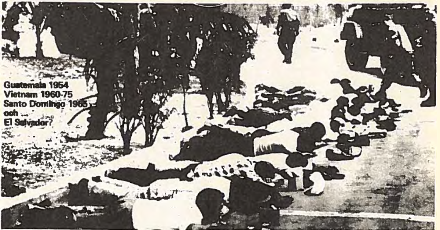
Guatemala 1954 Vietnam 1960-75 Santo Domingo 1965 och ... El Salvador?

USA-trupper i Santo Domingo i Dominikanska republiken 1965. USA har avdelat mer resurser för El Salvador idag än till någon annan kris i området sedan 1965.