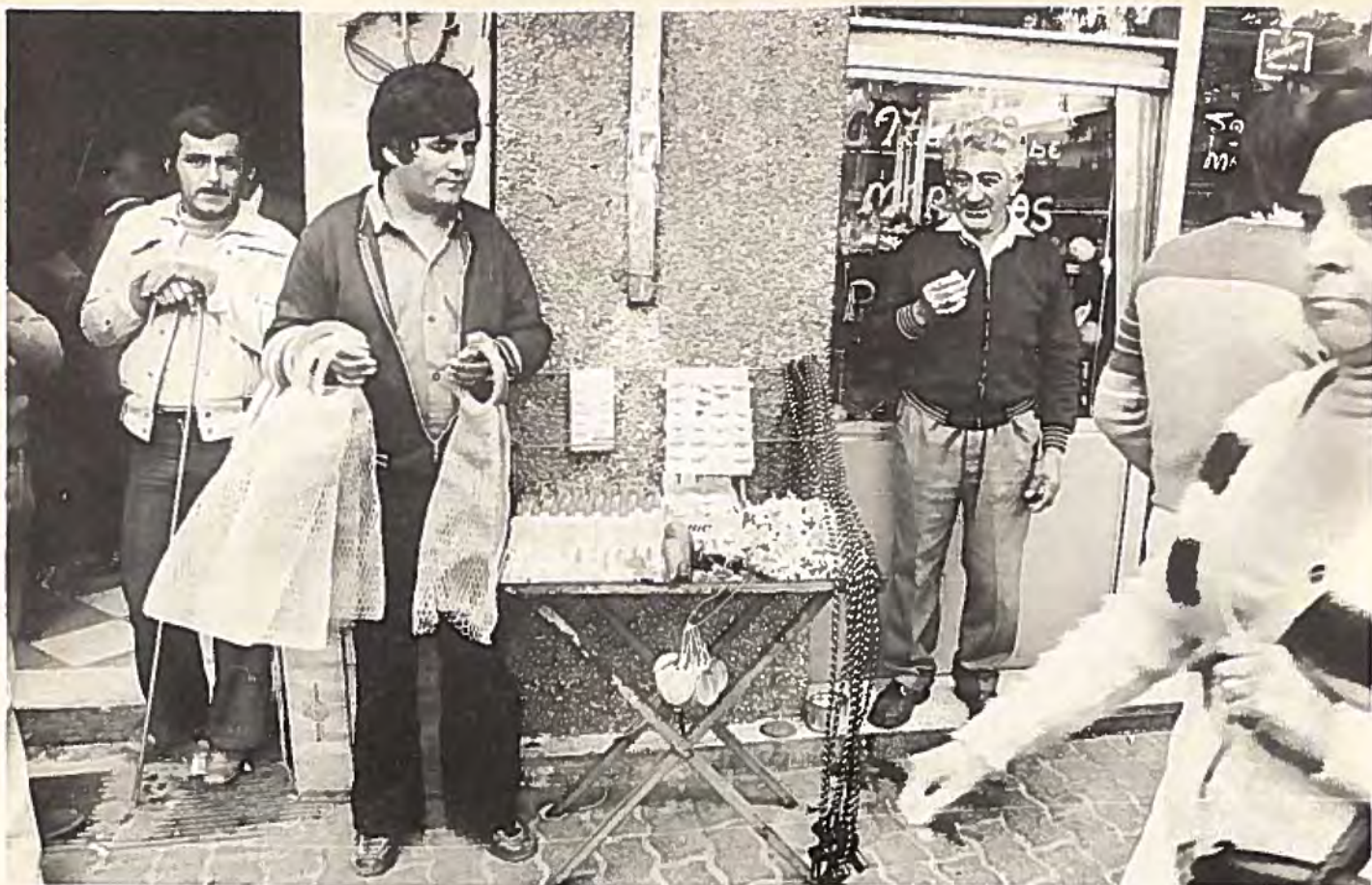
Juntas ekonomiska politik tvingar många företag i konkurs. De arbetslösa tvingas försörja sig på gatuhandel. Arbetarna mister sin fackliga bas. Kampen för att överleva blir det dominerande