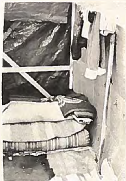
"Vi kvinnor ber regeringen öppna ögonen för våra krav på en bit mark, så att våra barn som Ni kallar Chiles framtid får en möjlighet att växa upp och leka i frihet."

TODAS LAS MUJERE PEDIMOS AL GOBIERNO ABRA LOS OJOS A NUESTRAS PETICIONES DE UN PEDAJO DE TIERRA PARA QUE NUESTROS HIJOS LOS QUE UDS. LLAMAN EL FUTURO DE CHILE