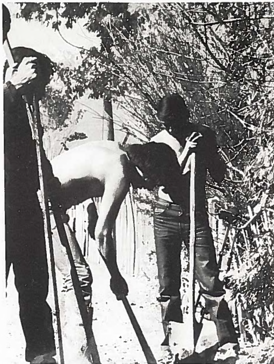
PEM och POJH arbetare i det fattiga området Tabancura i Santiago. Dessa arbetare kan liknas vid våra AK-arbetare på 1930-talet.