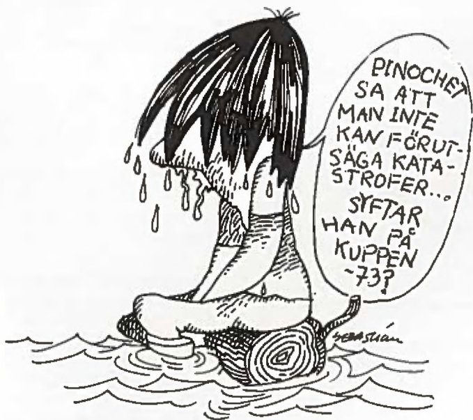
Illustration ur Fortín Mapocho

De som inte tror på en utväg a la Filippinerna pekar på Sydkorea där den folkliga protesterörelsen till slut framtvingade fria val. Inga jämförelser är mekaniska, men i Chile behövs det idag någon förebild att tro på. ►