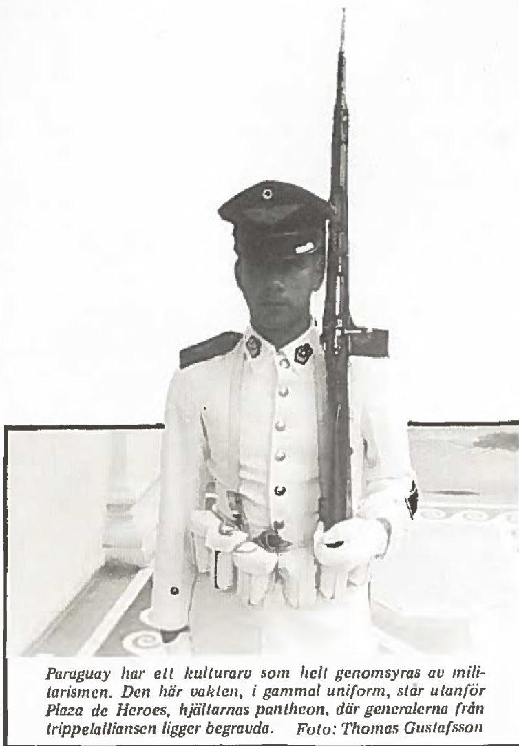
Paraguay har ett kulturarv som helt genomsyras av militarismen. Den här vakten, i gammal uniform, står utanför Plaza de Heroes, hjältarnas pantheon, där generalerna från trippelliansen ligger begravda.

Paraguays diktator, den 75-åriga Alfredo Stroessner, är förmodligen mest känd – eller okänd – för att han hjälpte den nazistiske krigsförbrytaren Josef Mengele att hålla sig undan rättvisan. Mengele skulle dömas för de grymma experiment han utförde på judar i Tysklands koncentrationsläger. Men blev istället väl mottagen i Paraguay.