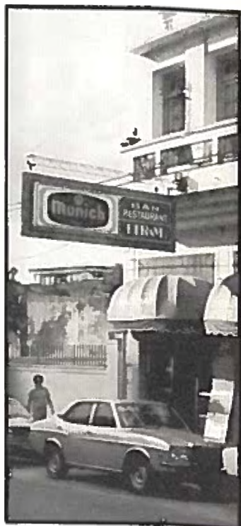
Det tyska inflyandet är stort i Paraguay. Många kom hit omkring 1945, man vill helst inte tänka på vad de gjort.