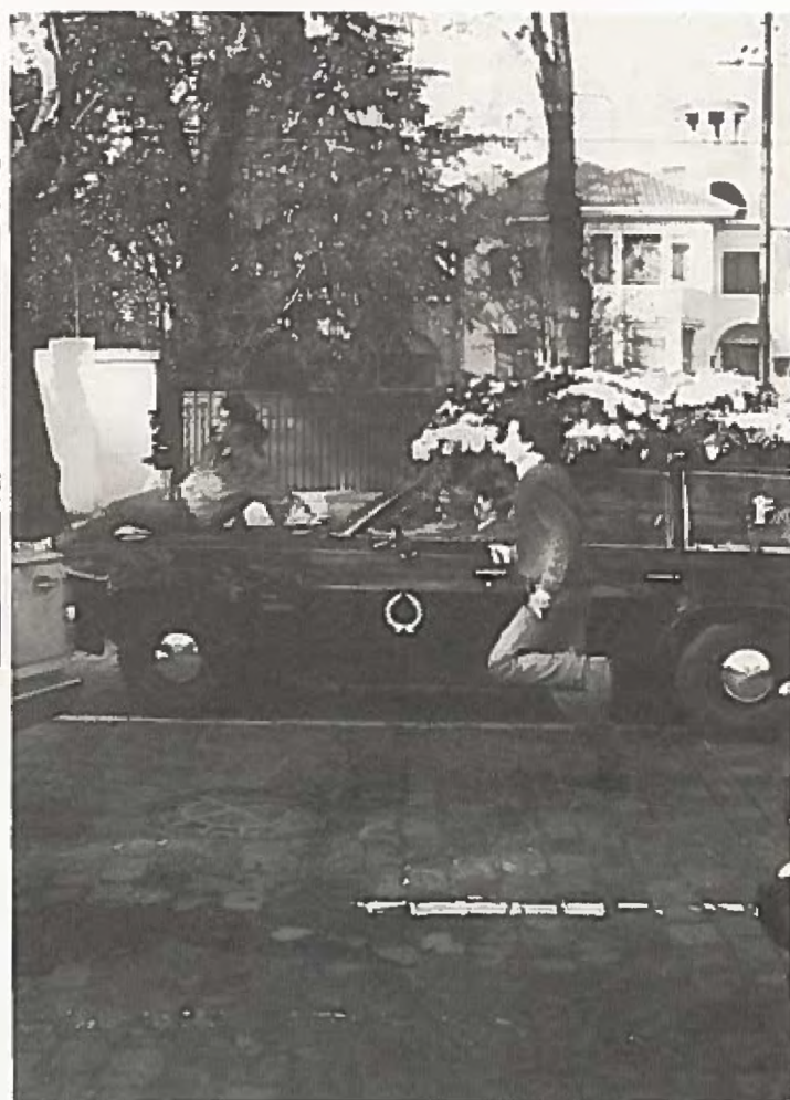
En av de tolv dödade begravs. För att hindra att begravningen blir en protestyttring försöker kravallpolisen tvinga bilen med kistan att köra fortare. Vänner och anhöriga gör vad de kan för att hindra att begravningsbilen kör ifrån dem. Framme vid kyrkogården har begravningsståget växt till en väldig manifestation.