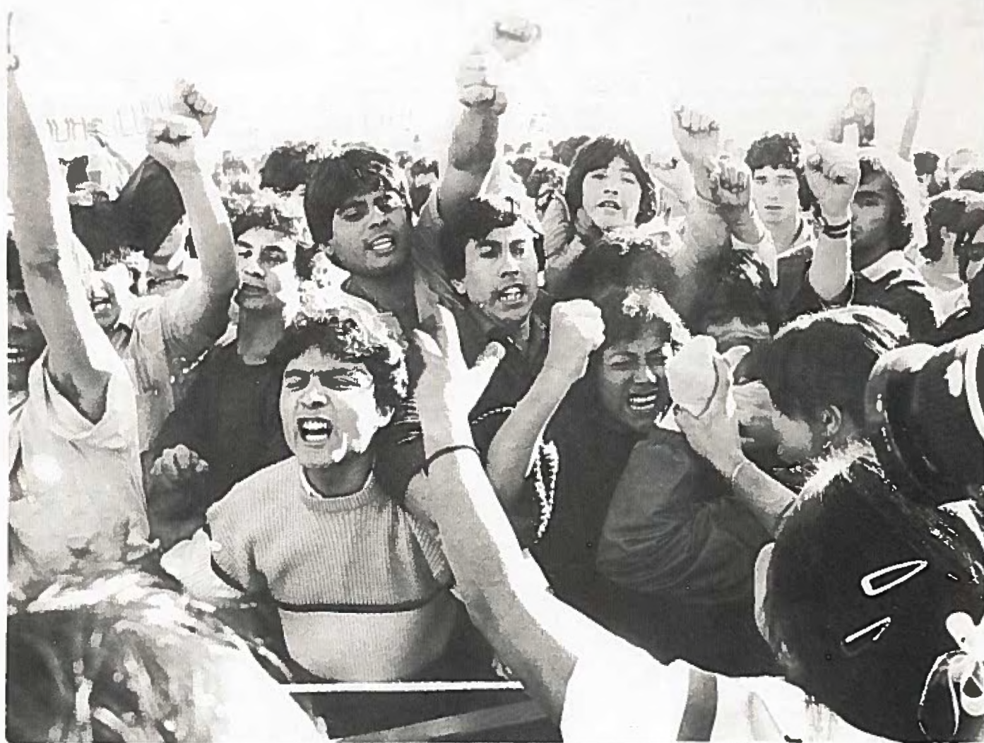
I La Bandera-parken uttryckte chilenerna sitt missnöje med regimen.