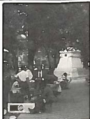
De här skopputsarna kommer inte in i den officiella arbetslöshetsstatistiken. På så vis kan regimen visa upp bra siffror för omvärlden.