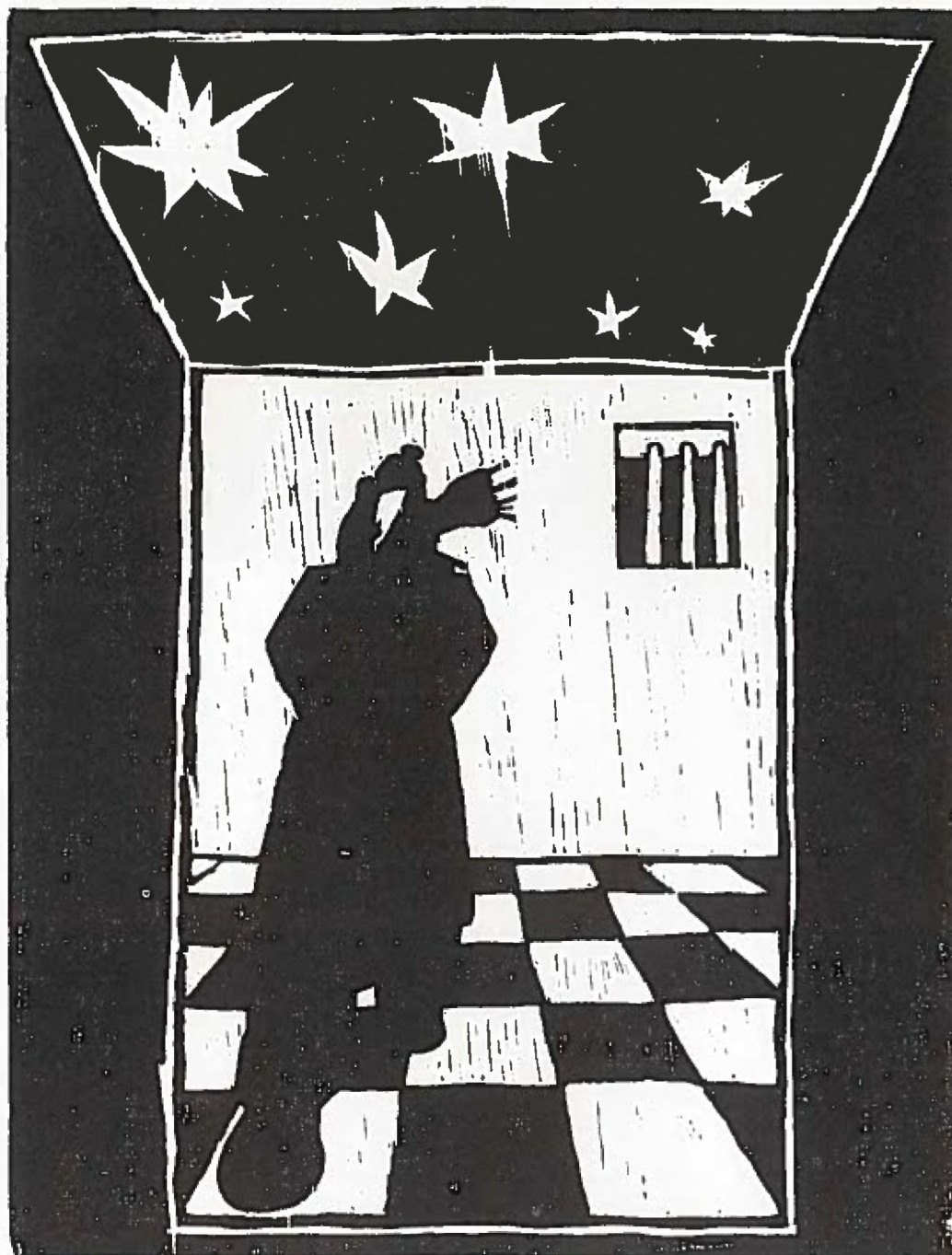
Illustration: Sergio Allesor

organisation, och jag blev snart indragen i det arbetet. 1981 valdes jag in i den första nationella styrelsen. På den tiden fanns det inte så mycket arbete för vår sak i folkets organisationer. Pressen bevakade inte heller som den gör nu, speciellt efter attentatet mot Pinochet, påvens besök, den senaste hungerstrejken etc.