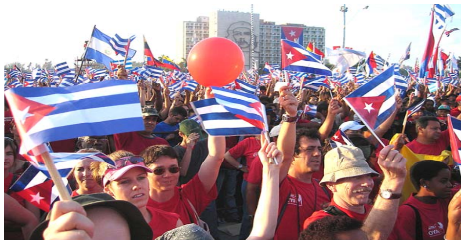
1 maj i Havanna 2006 med flera svenska deltagare.

Fira 1 maj på Revolutionstorget i Havanna! Två veckor med fullspäckat program tillsammans med Kubavänner från hela världen. Pris totalt ca 12 500 kr (ca 3 800 kr i avgifter plus flygbiljett som vi beräknar kosta ca 8 700 kr )